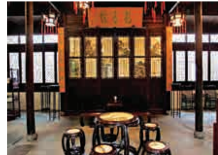
▲浙江海寧陳氏宅園安瀾園一處廳堂

金庸創作這部小說，民間傳說僅是線索，顯然考證了大量史料，對史料的選擇獨具慧眼，所關注的資料至今都有特殊意義。比如乾隆時入值軍機處的詩人趙翼，在筆記裏記載乾隆作詩情景：「詩尤為常課，日必數首，皆用朱筆作草，令內監持出，付軍機大臣之有文學者，用摺紙楷書之，謂之「詩片」。這據私家筆記明白記載，乾隆帝是寫出草稿，讓文學優