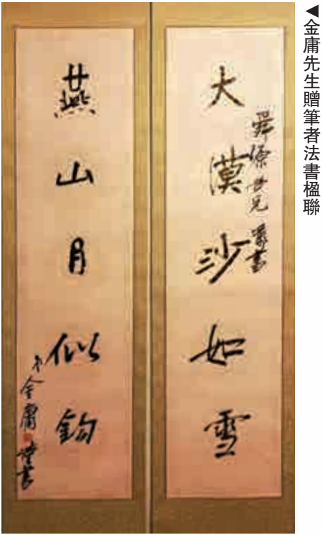
▲金庸先生贈筆者法書楹聯