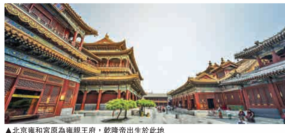
▲北京雍和宮原為雍親王府，乾隆帝出生於此地