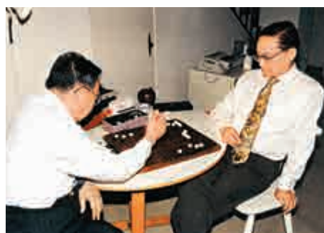
▲昔日大公棋友二十年後再相聚。上世紀八十年代金庸（右）、梁羽生對弈

十年前筆者為編寫《金庸圖錄》，與查先生（金庸）相識並蒙賞識和指教。此後深入研讀他的著作，結合自己的中國歷史特別是明清史研究，發現他的一系列武俠歷史小說，實際上是通過人物性格塑造，從文學的角度去解讀歷史，與史學家殊途同歸。史書記錄事情的梗概和結果；他的作品故事於史有據，筆下情節和人物心理活動，卻往往是史書所無法記載的。例如《射鵰英雄傳》開篇，書中人就說妥協投降、殺害岳飛、柏底下不希望打敗金國救回徽、欽二帝的，恰恰是當朝皇帝宋高宗趙構，而不是人人痛罵的秦檜。因為二帝還朝，秦檜可能照樣當宰相，趙構卻一定失去皇位。他的論文《袁崇煥評傳》揭示，袁崇煥的遭遇是「性格決定命運」的典型案例。