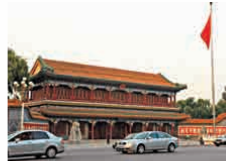
▲北京中南海新華門為乾隆所建寶月樓，民間傳說特為香妃建造