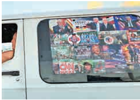
▲警方扣押的謝亞克貨車車窗上，貼有大量民主黨人及批評特朗普的圖片，並被標記十字