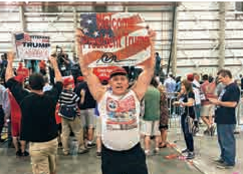
▲謝亞克的社交帳號中有大量支持特朗普的圖片