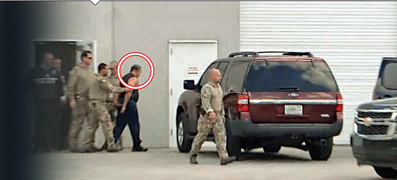
▲26日，美國連環郵包炸彈客謝亞克在佛州被警方逮捕