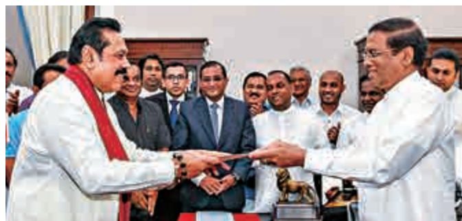
▲斯里蘭卡前總統拉賈帕克薩（前排左）26日就任總理

統一人民自由聯盟和統一國民黨自從2015年組成聯合政府以來，經常在經濟政策和政府管理等問題發生摩擦，例如在日前就因為維克勒馬辛哈計劃將港口租給印度而發生衝突。