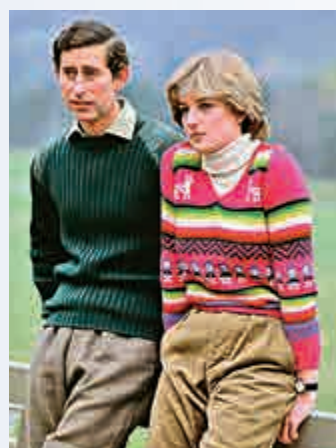
▲查爾斯（左）與戴安娜婚前的合影