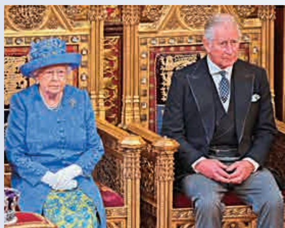
▲女王伊麗莎白二世（左）計劃在95歲後傳位給王儲查爾斯 資料圖片