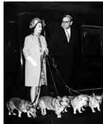
▲英女王1969年（左）在蘇格蘭度假後返回倫敦，手中牽着四隻哥基狗

不過事實上，自從2015年起，女王就決定不再養新的哥基狗，一方面是害怕自己會被狗絆倒，另一方面是不希望在自己去世後無人照顧牠們。現在女王還剩下武爾坎（Vulcan）和坎迪（Candy）兩隻道吉犬（哥基和臘腸狗的混種），但最為喜愛的哥基狗已經全部離開了。