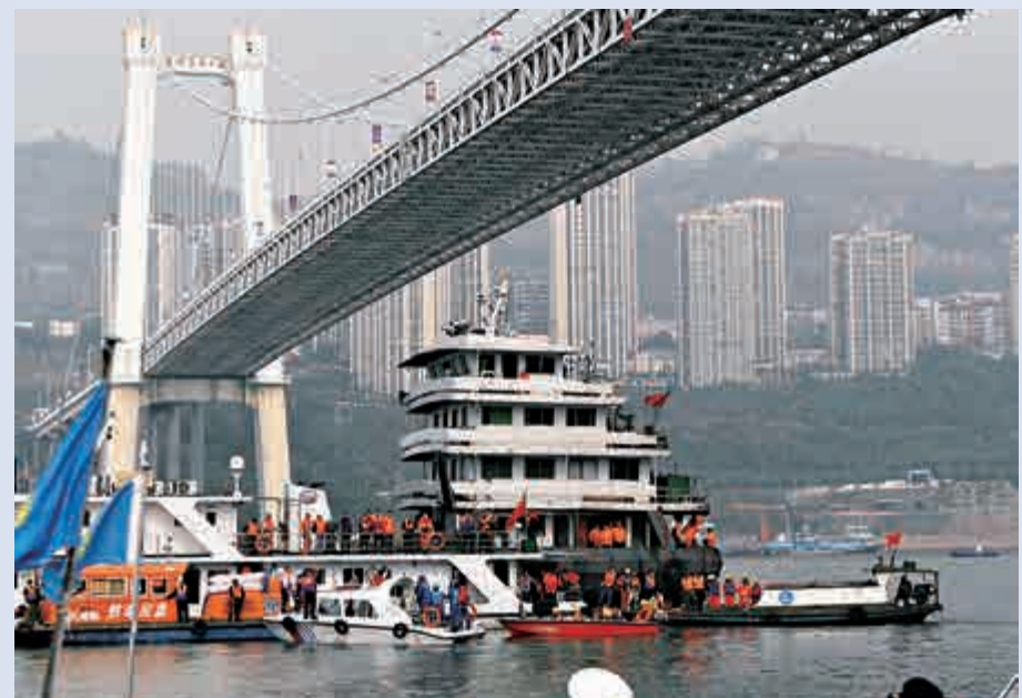
▲29日，重慶萬州巴士墜江事故救援工作繼續緊張有序進行，搜救船在墜江水域精確定位巴士位置後，根據打撈方案，潛水員到水下定位起吊

重慶萬州警方官方微博「平安萬州」28日發布巴士墜江通報：10月28日10時08分，一輛巴士與一小轎車在重慶萬州區長江二橋相撞後，巴士墜入江中。經初步事故現場調查，係巴士在行駛中突然越過中心實線，撞擊對向正常行駛的小轎車後衝上路沿，撞斷護欄，墜入江中。