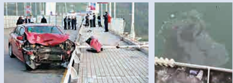
▲被撞紅色小轎車車頭受損嚴重 網絡圖片 ▲巴士墜江後消失，湖面上一片油污 網絡圖片