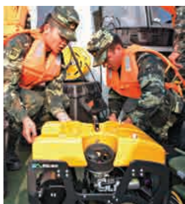
▲武警重慶市總隊船艇支隊隊員在調試水下機器人進行搜救

重慶官方發布消息稱，經公安機關走訪調查並綜合接報警情況，初步核實失聯人員15人（含駕駛員1人）。重慶萬州區已按照應急預案，正開展失聯人員親屬的心理疏導、安撫慰問等善後工作。應急救援指揮部組織法醫、痕跡等專業人員，提取失聯人員家屬DNA，為確認身份做準備。目前，報案失聯人員親屬的血樣已採集完畢。 在長江二橋事故現場，工作組仔細查看了事故發生時車輛運行軌跡和橋樑安全