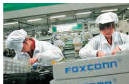
▲富智康認為，設備製造商競爭激烈，設備利潤下跌