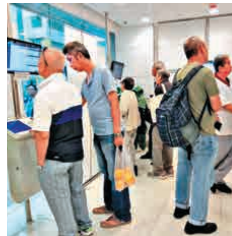
▲大批熊證昨日被收回，淡友損失慘重

區在26500至26599點，牛證重倉區在25100點至25199點。恒指牛熊貨比例由上個交易日34比66，變為43比57。至於騰訊方面，這個星期初其熊證是牛證街貨的三倍，只看街貨很多投資者早已看淡，日前騰訊熊證在280元和290元，目前已收回。