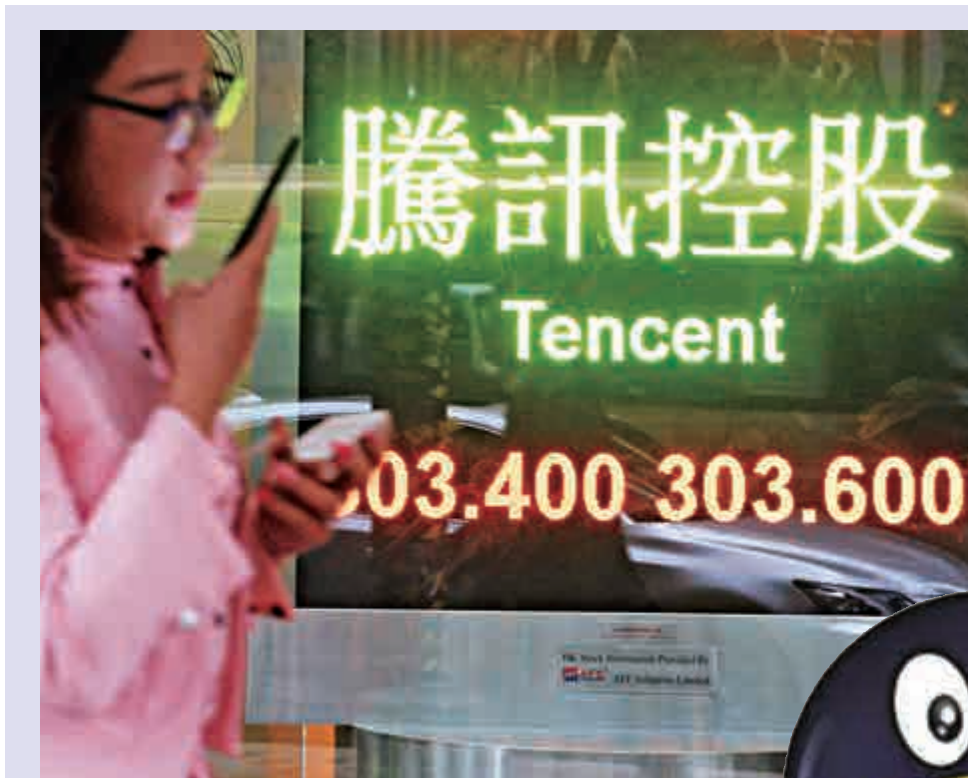
▲騰訊股價昨日回勇，全日升幅接近一成，重上300元水平

資料顯示，「猿輔導」股東包括IDG資本、華人文化產業基金，在2016年5月的D+輪融資中，成功引入騰訊。去年5月，「猿輔導」再完成E輪融資，涉及1.2億美元（約9.4億港元）。