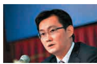
▲馬化騰強調數據保護

【大公報訊】騰訊（00700）主席馬化騰透過微信朋友圈表示，騰訊平台的數據遠比其他平台更具用戶個人隱私性，強調要加強數據的保護。