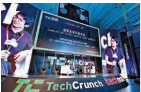
▲騰訊持創夢天地逾二成股權，為第二大股東

其他新股消息，下周一上市的龍資源（01712）公布招股結果，公開發售獲超額認購58%，發售價定為2.03元，一手的中籤比率100%。股價於暗盤價造好，根據獨立交易平台及羅才暗盤交易中心顯示，兩個交易平台龍資源都收報2.2元，高上市價8.4%，不計手續費，每手1000股賺170元。