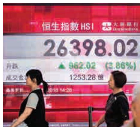
▲投資者憧憬中美關係改善，股票市場頓時亢奮，港股午後越升越有

筆者一直強調現時消息主導大市走勢，短線走勢是無定向，變相令長期投資者入市意欲薄弱，僅餘一些短線投機資金炒上炒落，但長倉資金十分謹慎，因為大市波幅太大，會令長線坐資的信心下降。投資者要留意11月6日便是美國中期選舉，特朗普突然向中國示好，或者只是想令美股回穩，增加選民對美國經濟的信心，為增加選情的手段，暫時不宜因為他一席話感到太亢奮，預期股市將繼續受相關消息舞高弄低，大市走勢會相當飄忽，升跌都會十分難料。