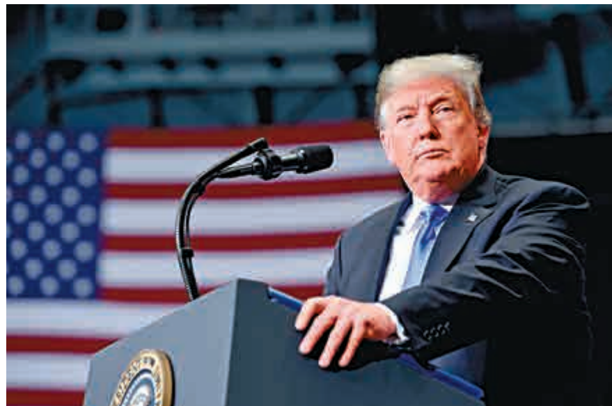
▲特朗普表示樂於與中方達成協議，令處於反彈的港股更如虎添翼，淡友手足無措慌忙補倉