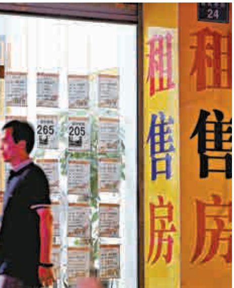
▲在樓市銷售遇冷的情况下，不少房屋中介公司銷售人員工作更賣力。

陸成在公開信中稱，近期將實施各項降經營成本的應急措施，公司內部也會全面提倡節約務實，力爭讓公司盡快恢復收支平衡，「這些「應急措施」多多