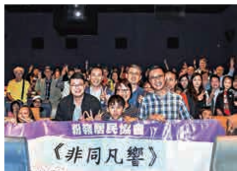
▶劉國勳（前排左）與楊潤雄（前排右）及普光學校的學生一齊看《非同凡響》

而楊潤雄亦在自己的Facebook放上首映禮的照片，他稱特殊學校同學的需要都是教育政策重點之一，並承諾會繼續投放資源，同時亦希望社會以愛心支持同學，令他們發放異彩。