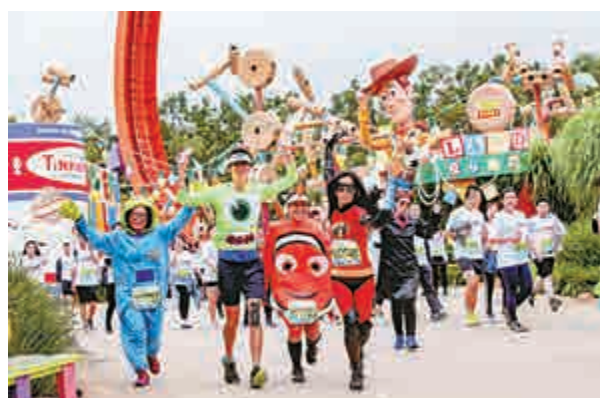
▲第三屆迪士尼跑逾1.3萬名健兒參與，較上屆增加25%

迪士尼將把活動部分收益，連同1100張樂園門票，捐贈與東華三院何玉清教育心理服務中心。為有特殊學習需要的兒童及青少年，以提供一個為期兩年的訓練計劃，助他們增進社交技巧，同時為家長和青年提供相關輔導和訓練。