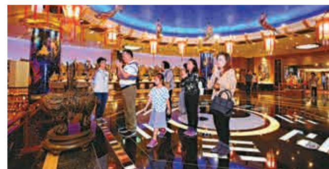
◀善信可進入太歲元辰殿等平日不對外開放的地方