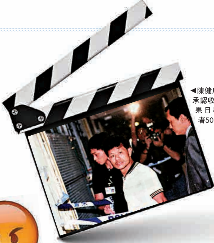
◀陳健康親口承認收取《蘋果日報》記者5000元