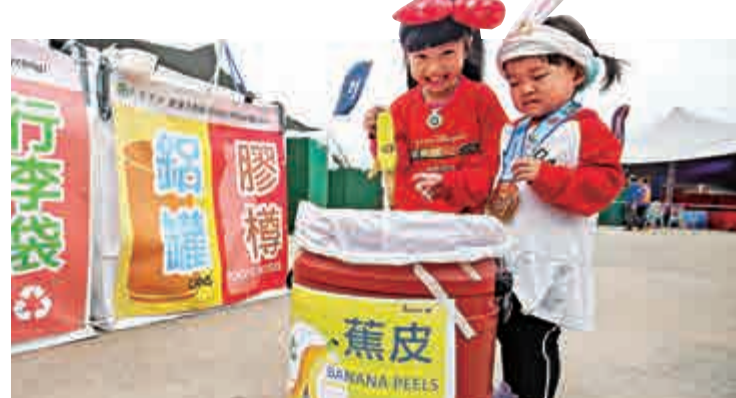
▲環團在現場回收塑膠、廢紙等