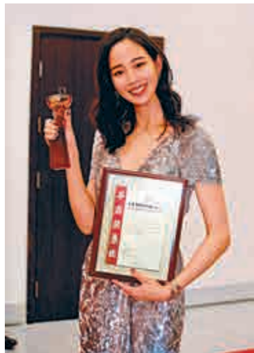
▲張鈞甯喜獲女配角獎