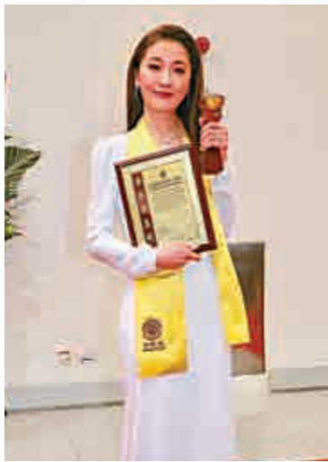
▲周勵淇表示會繼續做個好演員