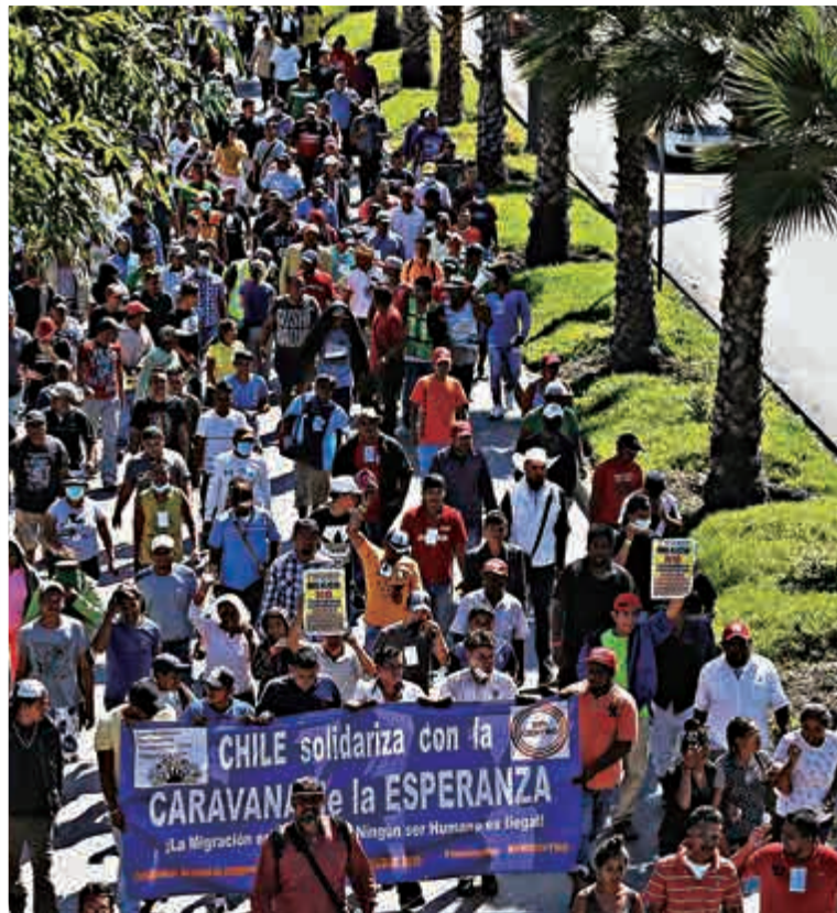
▲8日，不少已抵達墨西哥的中美洲移民走上街頭，抗議特朗普反移民政策，以及希望墨國能為他們赴美提供交通工具支援

據美國CNN新聞網站、哥倫比亞廣播公司等多個民調數據顯示，平均有超過七成的美國人支持DACA，並且對特朗普意欲在美墨邊境建築高牆的提案表示反感。