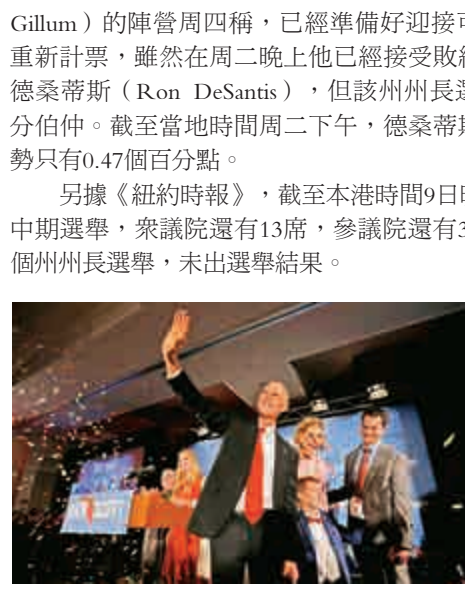
▲美國加州共和黨籍參議員候選人斯科特

另據《紐約時報》稱，截至本港時間9日晚間，本次中期選舉，眾議院還有13席，參議院還有3席，以及2個州州長選舉，未出選舉結果。