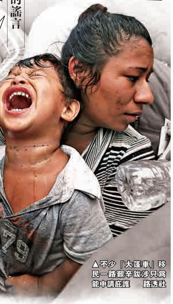
▲不少「大篷車」移民一路艱辛跋涉只為能申請庇護 路透社

謠言三 墨西哥警察遭移民襲擊 此前曾有墨西哥警察遭到襲擊後，血腫照片在網上流傳，並稱是由於墨西哥警察禁止中美洲移民入境，而遭到移民襲擊導致受傷。但後來證實，該照片並非來自這群中美洲移民，而是源自2012年墨西哥發生的其他事件。 來源：BBC