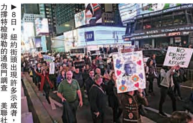
▲8日，紐約街頭出現許多示威者，力撐特檢穆勒的「通俄門」調查