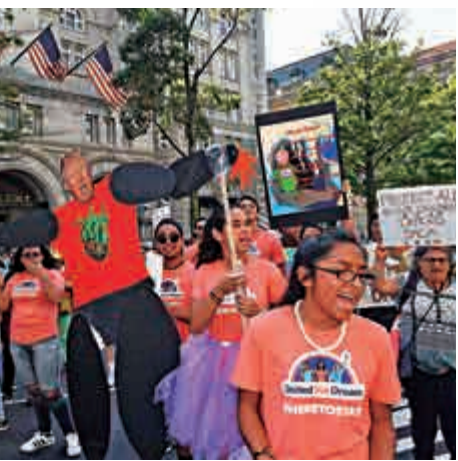
▲美國國內支持DACA聲浪不斷

【大公報訊】據英國《衛報》、英國BBC及《今日美國報》報道：美國中期選舉後，「大篷車」移民問題無疑再次成為社會焦點。白宮8日宣布，總統特朗普將簽署新行政命令，規定只有在美墨口岸入境的移民，才有資格申請庇護。而那些通過非法途徑進入美國的外國人，注定「美國夢碎」。