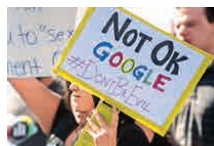
▲ 谷歌全球員工11月初抗議公司處理性騷擾事件不當

了改善臨時工和外包員工的待遇要求。谷歌10月底承認在過去兩年中開除了48名涉嫌性騷擾的員工，其中包含13名公司高層。而谷歌被爆向涉嫌性騷擾的「Android之父」魯賓支付高達9000萬美元遣散費一事更是直接引發了本月初谷歌在全球50座城市的約20000名員工集體示威。