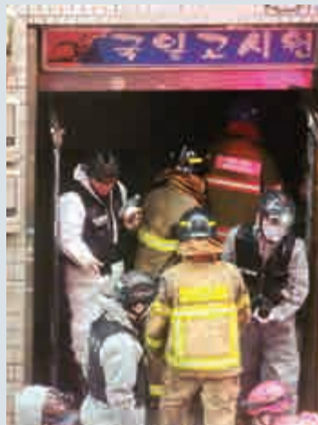
▲ 消防部門接到報警後立即出動173名消防員前往現場

警方及消防部門表示，將調查事故原因，並檢查安裝在每個房間的火警探測器是否正當。一名警官稱：「我們將調取監控錄像及調查目擊者，以確定是否存在犯罪可能。」