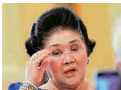
▲ 菲律賓前總統馬科斯遺孀艾美黛9日被判貪污罪成立

艾美黛曾在1986年與丈夫馬科斯一同逃亡美國，並在其1989年過世後，與子女返回馬尼拉並重返政壇。目前，艾美黛是菲律賓的國會議員，她本計劃在明年的菲律賓大選中參加州長競選。