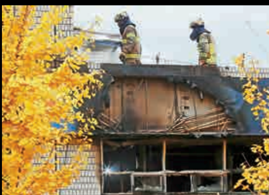
▲ 韓國首爾市中心一棟廉租屋建築9日發生火災