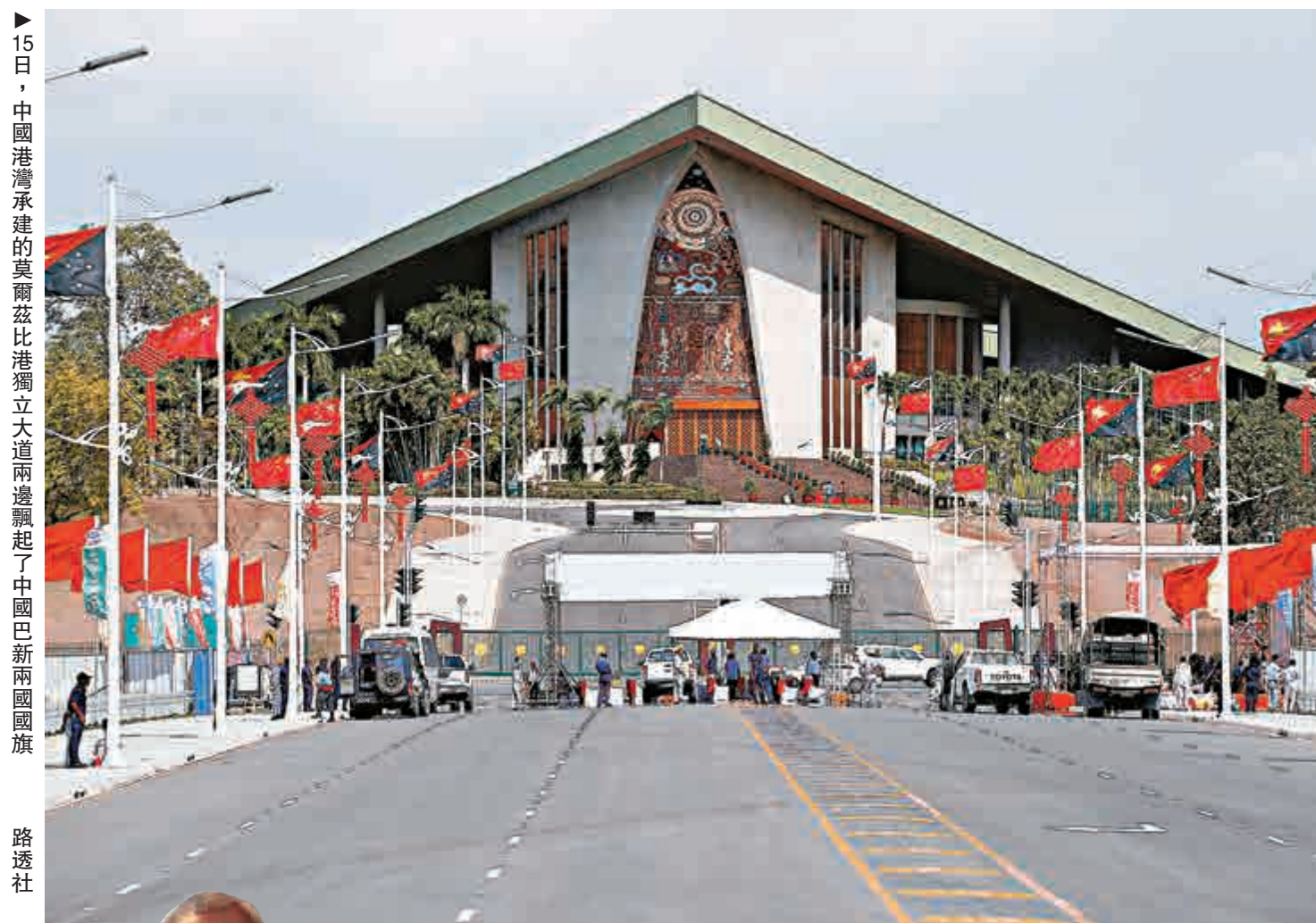
15日，中國港灣承建的莫爾茲比港獨立大道兩邊飄起了中國巴新兩國國旗