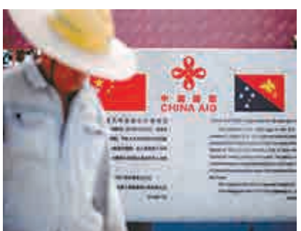
▲巴新獨立大道上的「中國援助」標誌

全球研究諮詢公司牛津商業集團最新研究報告表明，包括高地公路在內的交通基礎設施升級改造是巴新發展物流行業的關鍵，也將促進農業和礦業的發展。