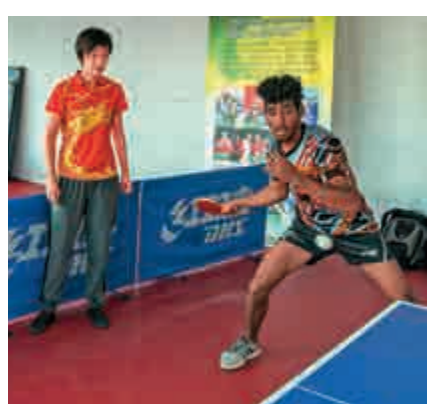
▲奧運乒乓球冠軍張怡寧(左)指導巴新國家隊隊員

今年APEC峰會的註冊中心設立在首都莫爾茲比港韋蓋尼地區體育中心，這座中國28年前援助巴新的體育設施裏至今還頻繁舉行體育比賽，很多人都知道這是來自中國的禮物，是1991年南太地區運動會比賽場地。 來自巴新的國際奧委會委員阿皮拉曾作為巴新代表團成員參加2008年北京奧運會。她稱體育是令巴新走進中國的重要紐帶。今年有四人巴新乒乓球運動員在上海訓練，這四名乒乓球運動員的水平或許難以打過一般中國運動員，但在南太平洋地區島國也是一把好手。同時，就在這個月的11日到17日，上海體育學院中國乒乓球學院在莫爾茲比港舉辦了訓練營，上海體育學院副院長、中國乒乓球學院院長施之皓與上海體育學院中國乒乓球學院教師、奧運冠軍張怡寧也來到訓練中心指導巴布亞新幾內亞國家隊隊員。