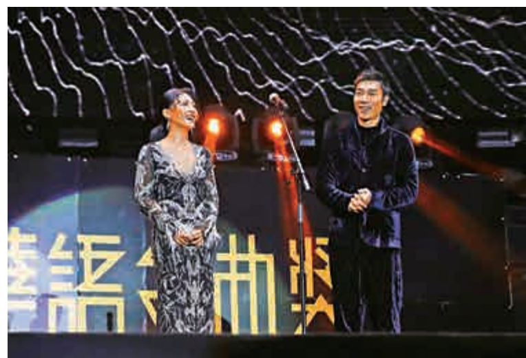
▲「2018全球華語金曲獎」最佳男、女歌手分別歸屬許志安（右）、艾怡良