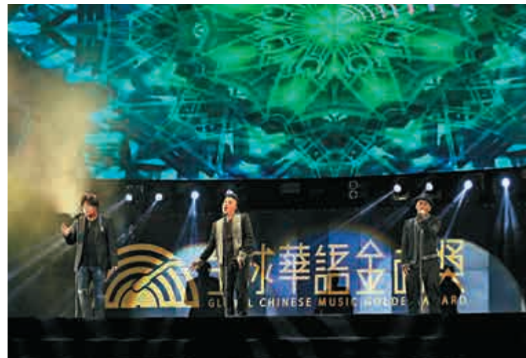
▲「2018全球華語金曲獎」頒獎禮本周在澳門金光綜藝館舉行