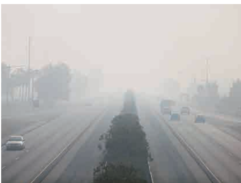
▲「坎普山火」使加州的99號公路被煙霧籠罩

當地的多所大學和中學仍然停課，預計22日感恩節後才恢復上課，而正常上課的學校則限制學生出動，取消了體育課和戶外活動。