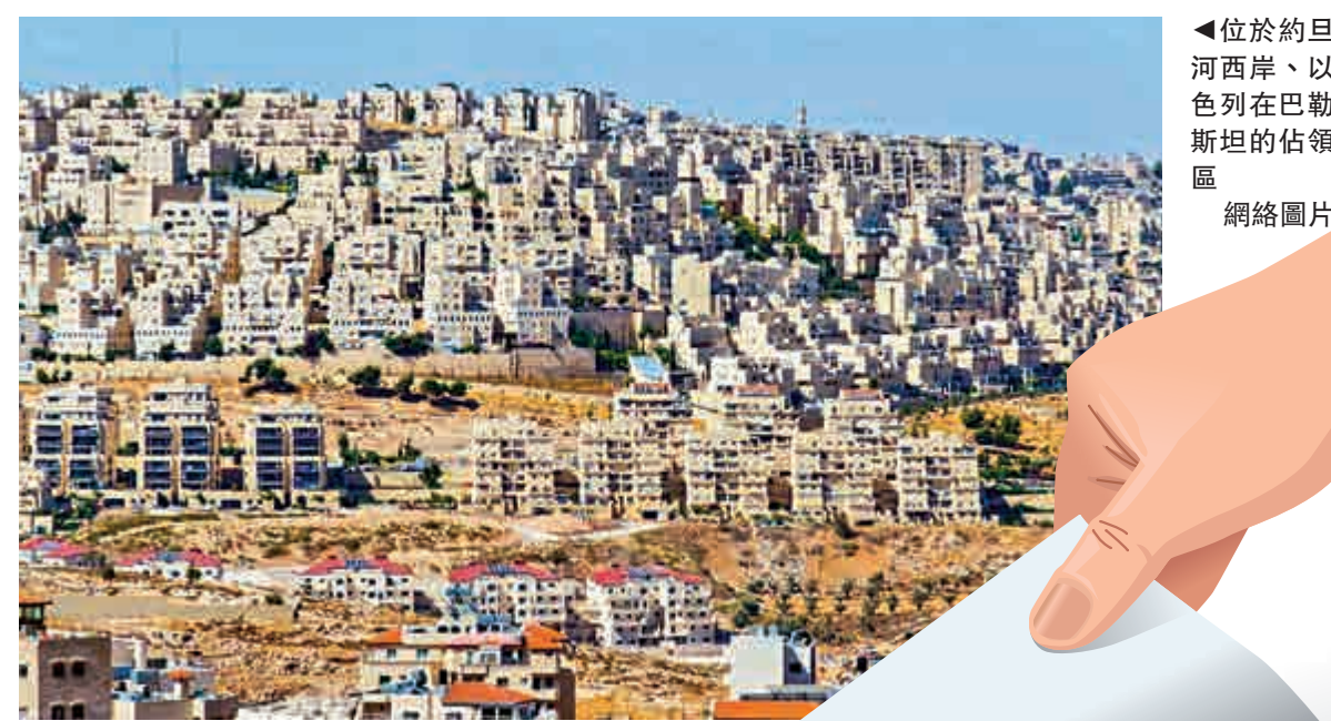
位於約旦河西岸、以色列在巴勒斯坦的佔領區 網絡圖片

即時生效的措施限制該企業在以色列的商業活動，與此同時將重啟項目鼓勵以色列佔領區的房屋短租服務。以色列戰略事務部長支持受影響的房東提起訴訟。他還表示，美國25個州存在相關法律禁止美國公司抵制以色列，因此將與美國官員討論此事。