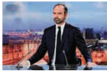
▲法國總理菲利普宣布將上漲外籍學生的註冊費用 法新社

與此同時，法國政府也將針對不屬於歐洲經濟區（EEE）的外籍學生調漲學費。法國大學學費相較於其他發達國家而言非常低廉，以2018—2019學年度爲例，公立大學學士課程學費爲170歐元、碩士學費爲243歐元、博士課程爲380歐元，外籍生與本國生繳