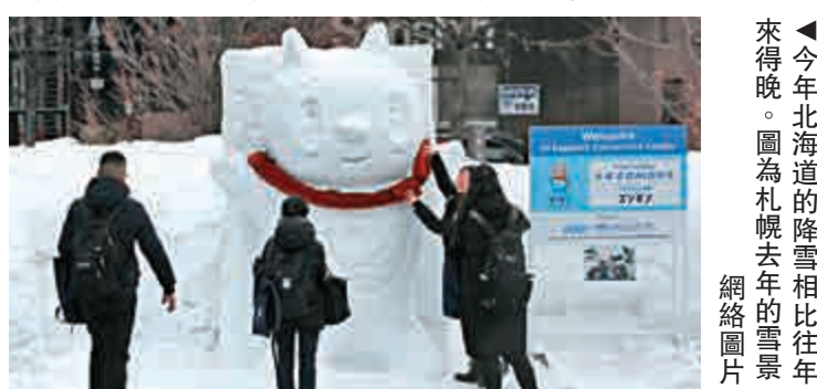
▲今年北海道的降雪相比往年來得晚很多，截至11月10日仍未有降雪，札幌市的溫度更有17.2攝氏度。北海道北部的稚內市、旭川市和網走市直到11月14日才降下初雪，而帶廣市則到19日才下雪。 氣象廳預測，受冬季氣壓影響，本周氣溫將驟降，使北海道降雪的可能性再提高。

據札幌氣象台稱，北海道上空約1500米處流入的寒冷氣流使氣溫降至約零下6攝氏度，受此影響，札幌市在當地時間凌晨0時50分開始下雨夾雪。大約凌晨3時，