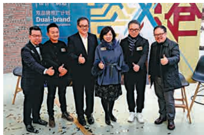
▲香港創意設計業界首次組團參與「成都創意設計周」