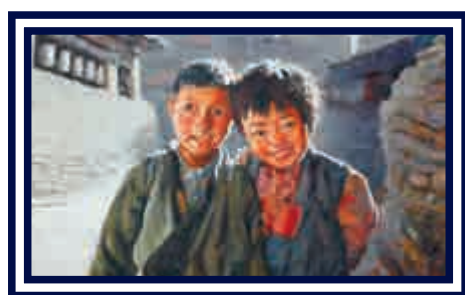
▶人像作品富有感染力