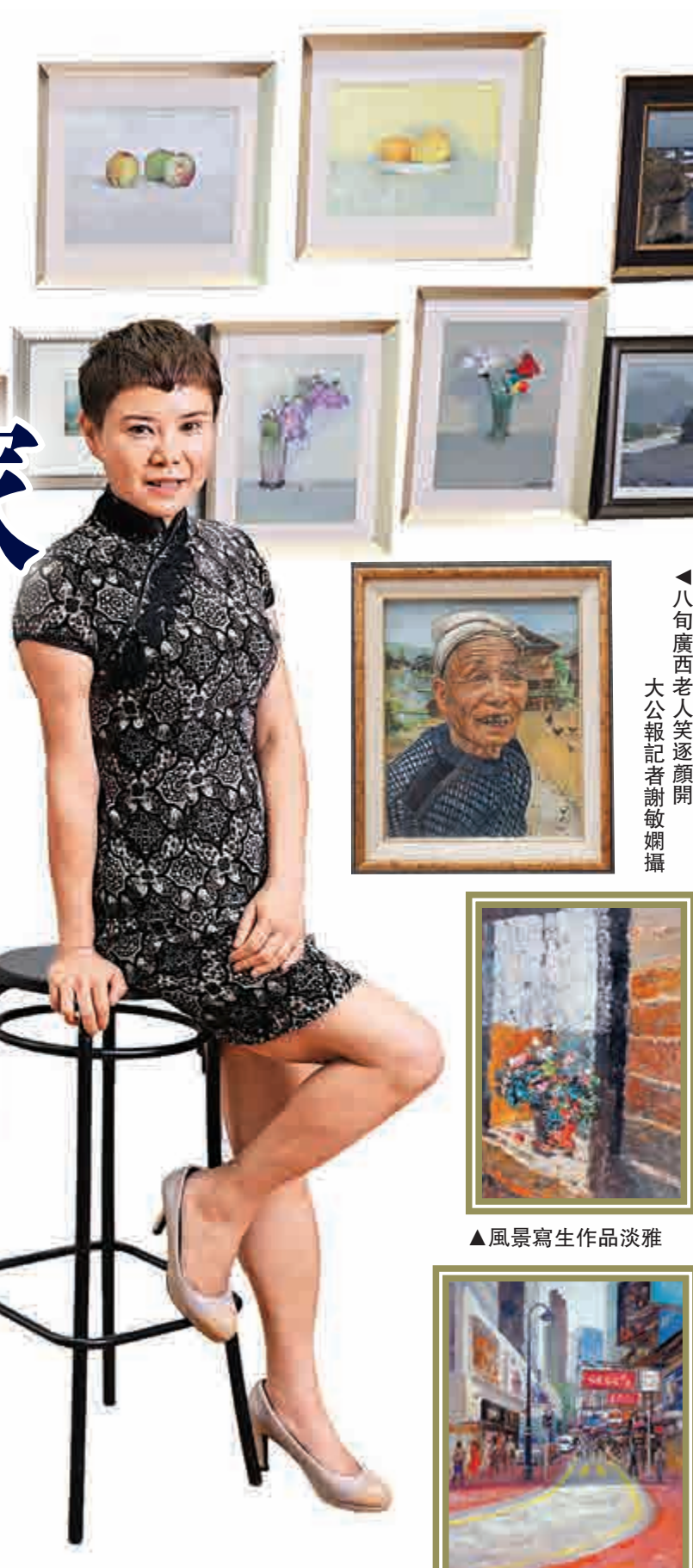
▲八旬廣西老人笑逐顏開