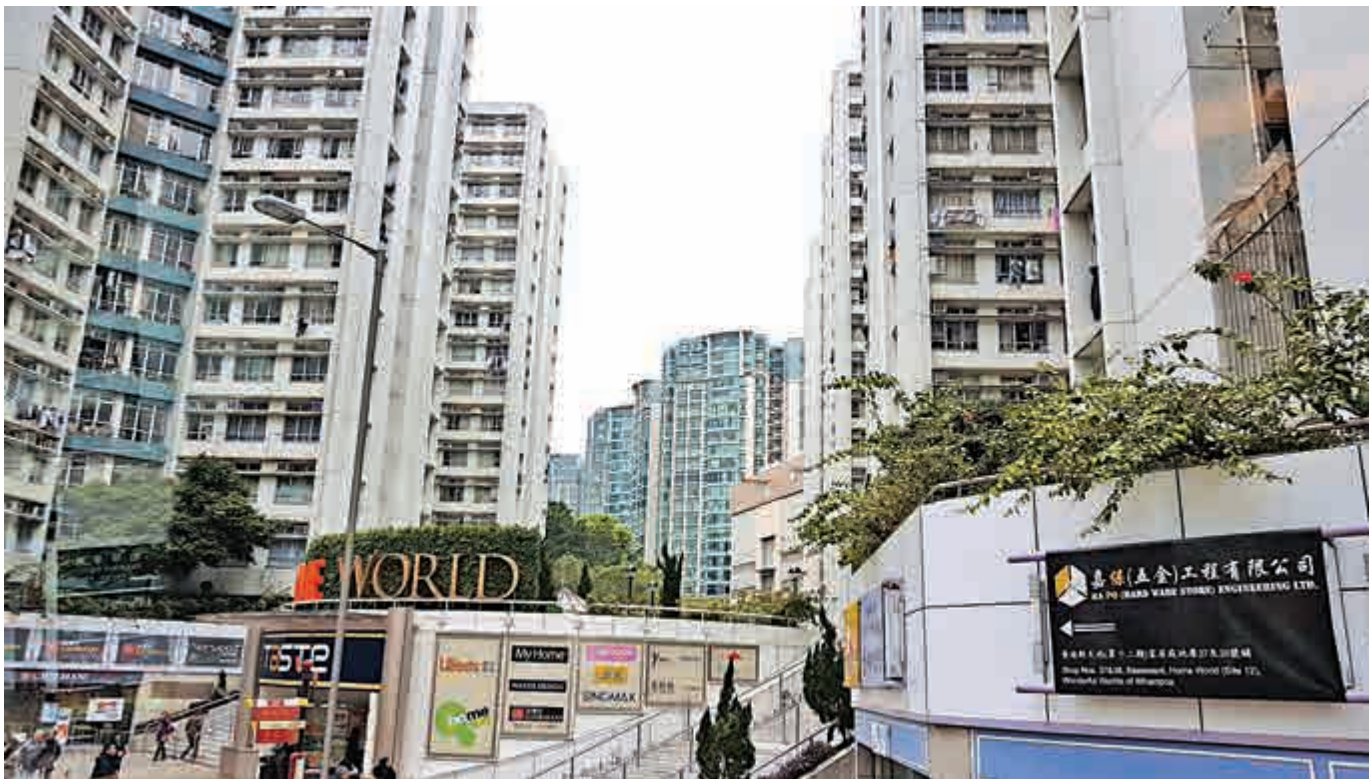
▲紅磡黃埔花園有大單位以呎價一萬二千八百元沽出