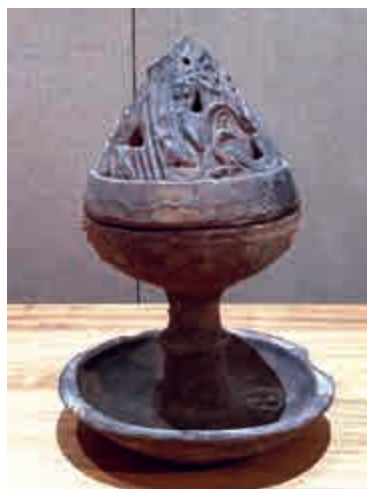
▲漢托盤式博山陶熏爐