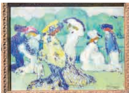
▲畢加索一九〇一年作《奧特伊賽馬盛會》（油彩畫布，52.2×67.8公分），於「傾彩」展覽呈獻