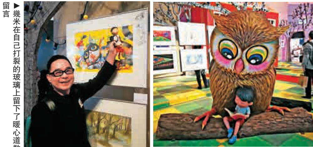
▲幾米在自己打裂的玻璃上留下了暖心道歉的留言 ▲新作《不愛讀書不是你的錯》的立體場景