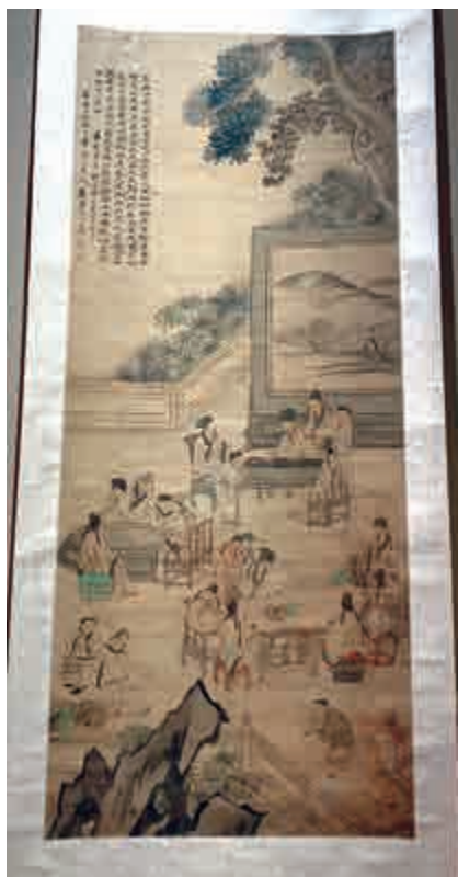
▲清代《十八學士圖軸》