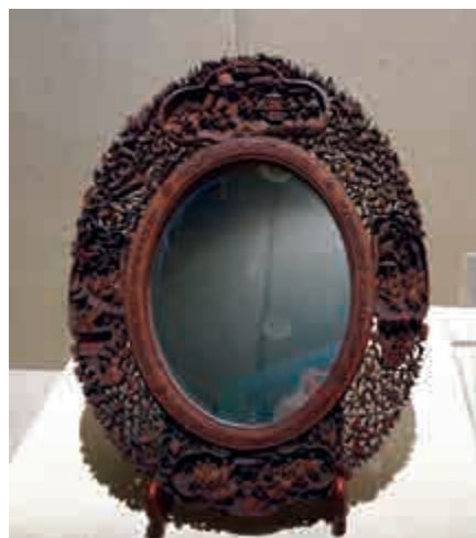
▲十九世紀的檀香木雕人物花卉圓鏡