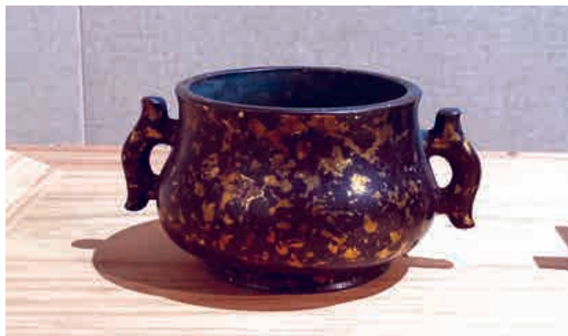
▲明宣德款嵌金片雙耳銅爐