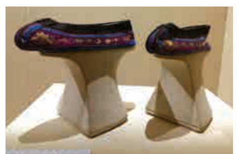
▲清紫色絲綢繡花「馬蹄底」女鞋

來、如何使用等問題，本次展覽設計了三個部分的内容：第一部分「揭秘嗅覺」，展出了自然界不同環境下生存的動物的標本，探索動物獨特的嗅覺功能；第二部分「眾裏尋香」，參考了宋代《香譜》、明代《香乘》等古代香文化記載，選取珍貴香料沉香、檀香、降香、麝香、龍涎香，也收集常見香料