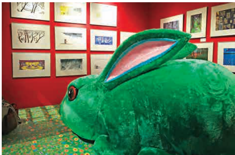
▲展覽隱藏「彩蛋」的「巨大毛毛兔」