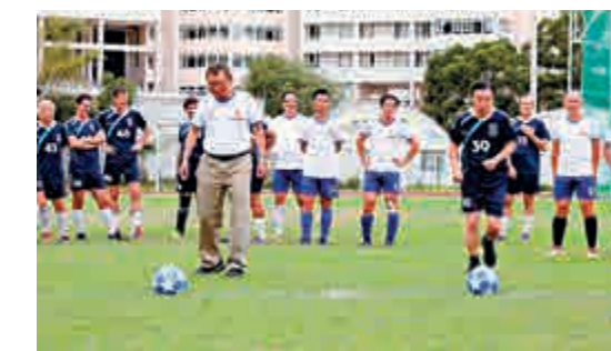
▲中大校長段崇智（左）與港大校長張翔（右）主持開球禮

一度兩間大學的體育盛事，以促進兩校教職員的友誼和合作精神。連同今天的賽事，中大共贏十場、港大勝一場，四次打成平手。