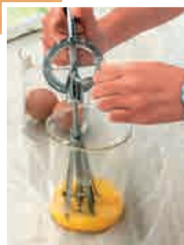
▲蛋液在地球上經攪拌後會起泡，在太空也會起泡嗎？