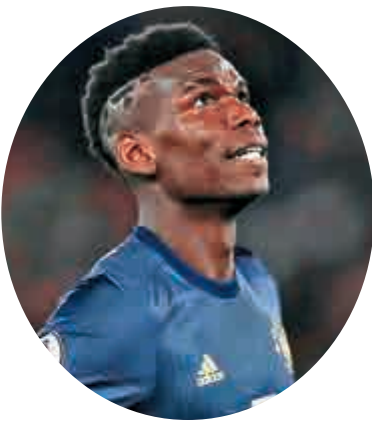
▲曼聯中場保羅普巴

1線強隊在例如法國、英格蘭等在外圍賽順利出線毫無問題，在2、3線球隊中，於歐國聯B級取得小組首名的4支球隊波斯尼亞、烏克蘭、丹麥和瑞典，以及C級的首名蘇格蘭、挪威、塞爾維亞和芬蘭，都已確保取得附加賽席位，即使在外圍賽失手亦有「保險」，而且C級的球隊在附加賽不會越級面對B級球隊，換言之B級的幾隊只會面對更弱的球隊，C級的最多只會和同級打拚，上述幾隊若在外圍賽遇上「生死戰」，意義和味道已不可同日而語。還有D級的格魯吉亞、馬其頓、科索沃和白俄羅斯，可以預期他們已「壘埋心水」踢附加賽，外圍賽只當練兵，樂觀來說或更有利發揮，但球員的鬥心已不在此。