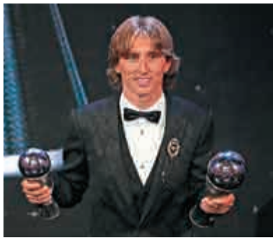
▲莫迪歷早前榮膺世界足球先生

根廷球星美斯，將繼世界足球先生後再次3甲不入，其效力的巴塞隆拿主帥華維迪替美斯感不值，他說：「我和任何人都會感到驚訝，今屆歐聯分組賽首、次和第5輪，美斯都獲選最佳球員，第3和4輪他因傷沒有比賽，這是歐洲足協評選的，並非我們說了算，他未能入局實在有點奇怪。」主辦單位今年新增設的女子金球獎，以及專為21歲以下球員而設的高柏契斯兩項殊榮，亦會在頒獎禮頒發。