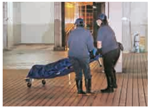
▲伏屍天台鹹水缸的女保安員遺體由件工抬走