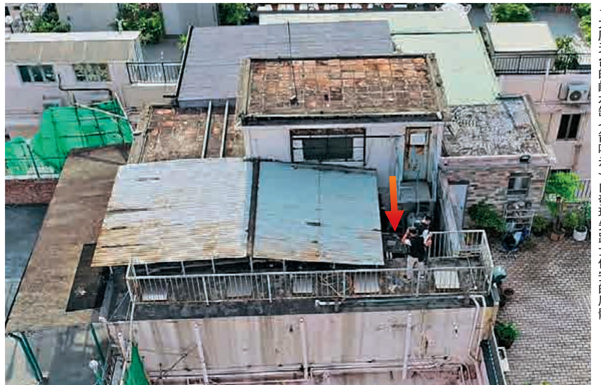
▲大廈天台的鹹水缸（箭咀示）內發現失蹤女保安的屍體