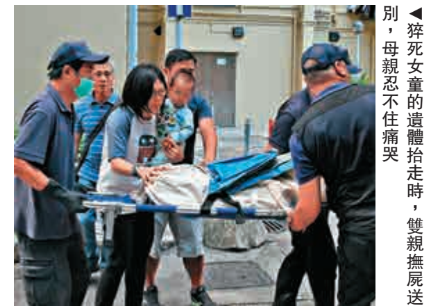
▲猝死女童的遺體抬走時，雙親撫屍送別，母親忍不住痛哭

至下午約二時，女童的遺體由件工抬走，母親緊抱一名嬰兒，由丈夫和一名較年長的男親友，陪同女童「離開」。當女童的遺體送上黑箱車，母親和父親撫屍道別，母親已忍不住哭泣，流淚目送女兒「乘車」永別，及後她由丈夫安慰下，返回大廈。