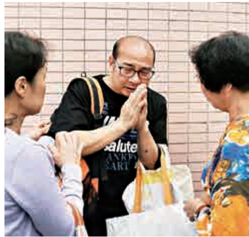
▲喪生女保安員的丈夫情緒激動，由女親友陪同離開

警員及消防員到場打撈後，確定女子為失蹤的嚴婦，已死去多時，消防員並在鹹水缸內檢獲一把生果刀，加上水缸蓋關上，令案情平添可疑。但警方調查發現，嚴婦沒明顯傷痕，身上有兩封浸濕的遺書，一封給家人，另一封給公司，內容大意謂受工作困擾，探員亦發現鹹水缸的水箱蓋為油壓式自動關上，相信案件無可疑，暫列屍體發現案，嚴婦死因則有待剖驗。