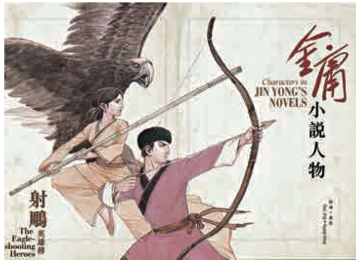
▲二元郵票以《射鵰英雄傳》中黃蓉與彎弓射鵰的郭靖為內容 香港郵政圖片