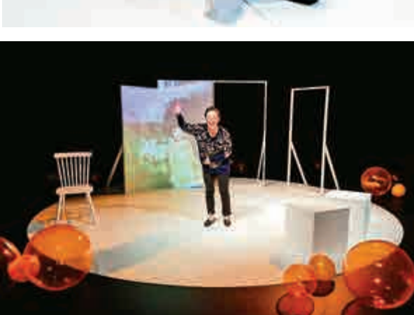
▲年長媽媽提及小時候的長女（即姊姊）時充滿愛心 ▲第三代媽媽對着初生女嬰時夾雜着溫柔、期盼與好勝