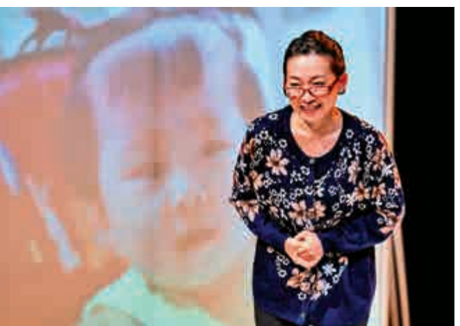
▶長女（即姊姊）自殺後，年長媽媽憶起她的童年，心裏難受