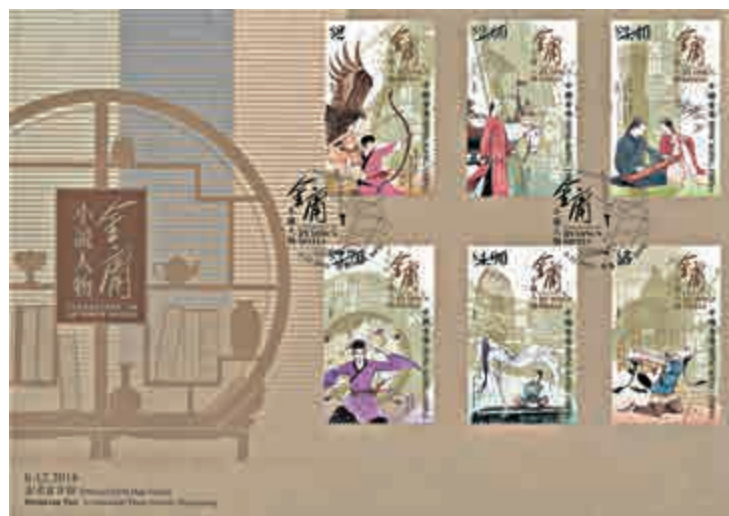
▲貼上六枚郵票，用特別郵戳蓋銷的首日封只可於六日當天在集郵局購買 香港郵政圖片