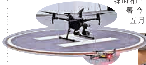
▲機電署研究用無人機航拍機檢查機電裝置

機電署並設立創科專區及平台，透過全息影像(hologram)和虛擬實境(VR)等技術，讓學員實踐機件維修保養。薛永恆說，機電設施日常使用繁忙，VR技術有助學員先了解現場工序，數碼化互動也可改變沉悶教學方式，吸引更多年輕人入行。