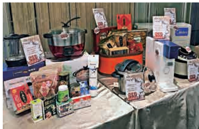
▲今屆工展會推出80蚊超筍貨，有鮑魚、廚具甚至分體式冷氣等 ◀「工展小姐」亮相，成為拍攝焦點