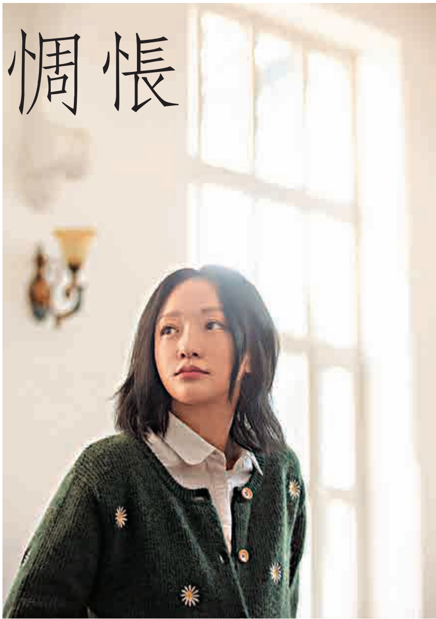
▲之華似乎沒什麼知心朋友