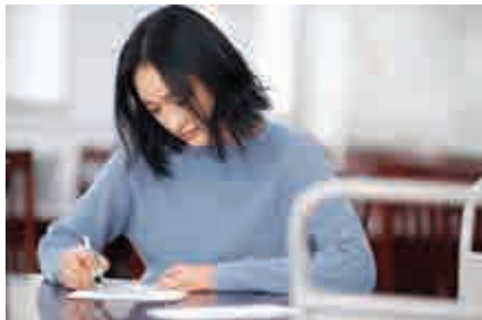
▲之華手機被砸後，選擇寫信給尹川