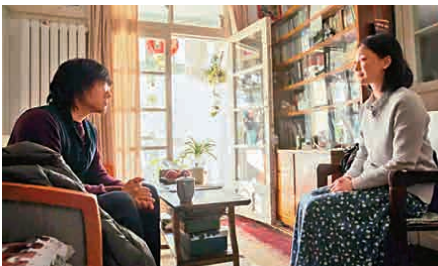
▲之華(右)再見尹川，憶起年少時的情事

扭橋缺陷以外，也有不少環節值得討論。《七月與安生》一個令人很意外的地方是，曾國祥作為香港人，拍出來卻很接地氣，他在內地居住了頗長時間確是事實。而岩井俊二卻極力將大連拍到像日本北方一般，街道及建築井井有條、一塵不染、空氣澄明、人煙稀少。看到片尾字幕，見到不止攝影指導及camera operator都是日本人，燈光、收音、化妝、服裝也是。