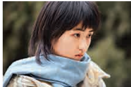
▲少女之華與姐姐相比只是「醜小鴨」