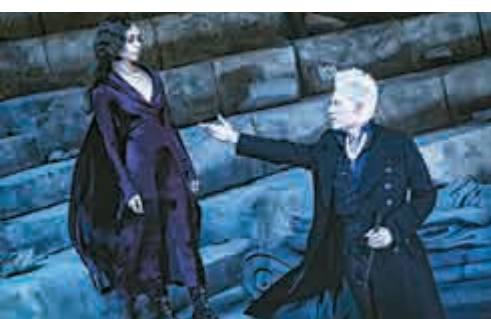
▲《怪獸與葛林戴華德之罪》成為香港上周票房冠軍