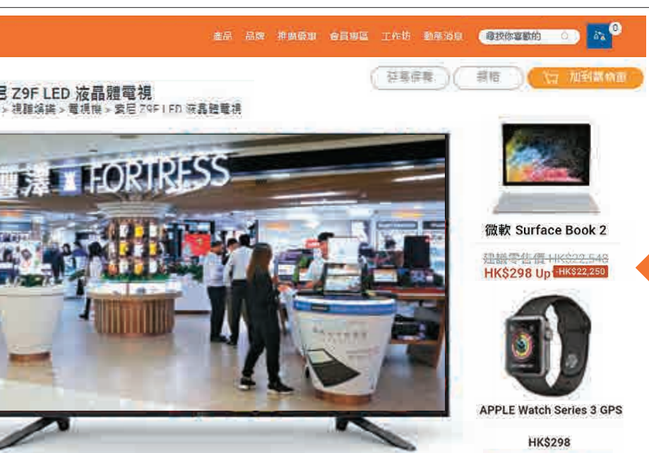
▲豐澤網店驚現「全場大平賣」，多款貴價電器割價至298元，後稱是網站故障「標錯價」急截單

環保署收到多次投訴，不滿有關聲響令人煩擾，遂於今年3月9日向該店發出「消滅噪音通知書」，要求4月16日起計的六個月內，晚上11時至清晨7時期間降低