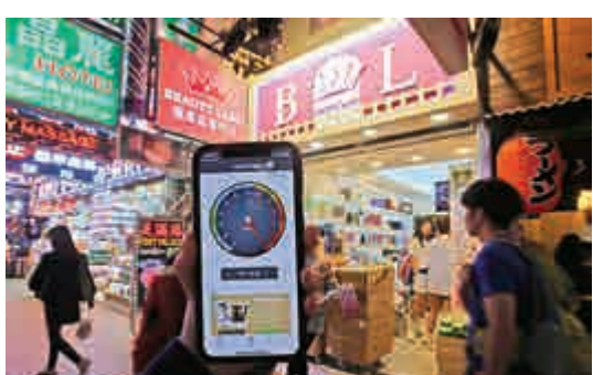
▲記者現場直擊，涉事店舖將揚聲器放在門外播歌，實測音量達120分貝

【大公報訊】記者林海瑩報道：旺角山東街一間韓國化妝品店長期「無限LOOP」大聲播放韓文歌，深宵11時後仍不停止，街坊不堪其擾，形容被歌曲日夜轟炸下「唔識韓文都聽到識背！」更有居民「頂唔順換咗雙層玻璃」。店方被環境保護署警告要降低音量，但仍無收斂，昨日在觀塘裁判法院被裁定違反《噪音管制條例》，罰款9000元。大公報記者昨午現場直擊，該店將揚聲器放在門外播歌，實測音量達120分貝。環保署稱會繼續派員跟進。