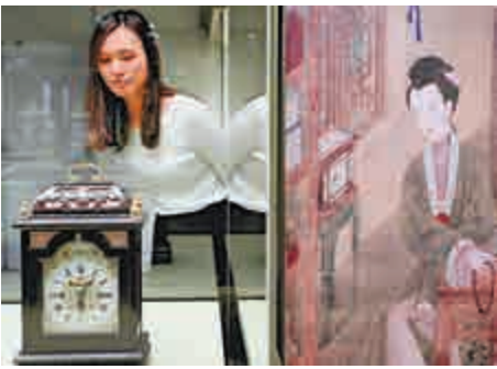
▲紫檀木樓時鐘旁懸掛清雍正《十二美人圖》之《珍珠觀貓》作參考，由此看出西洋鐘錶在當時是宮中重要物件