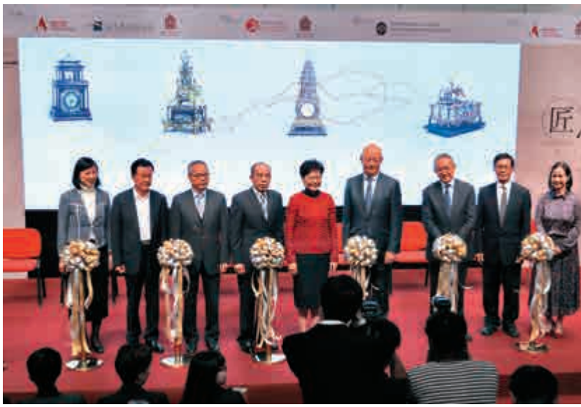
▲李美嫦（左起）、許榮茂、劉江華、紀天斌、林鄭月娥、Ian Blatchford、周永健、程伯中、陳淑文昨日出席「匠心獨運——鐘錶珍寶展」和「絲路山水地圖展」開幕禮，並主持剪綵儀式