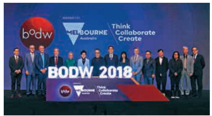
▲眾嘉賓主持設計營商周開幕禮