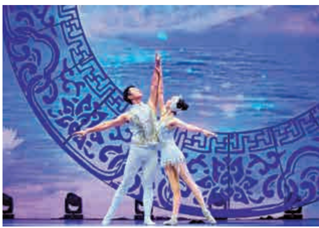
▲《肩上芭蕾》曾奪得第三十二屆蒙地卡羅國際馬戲節「金小丑」獎

專場也匯聚了諸多粵港澳地區最具代表性的民間藝術和傳統文化，舞台設計上力求通過多媒體的呈現，讓大灣區每一個地方的風土人情和傳統文化得以展示。如開場舞蹈《鼓舞嶺南》就以廣東代表性的高樁醒獅、英歌、錢鼓等民間藝術形式融合廣東音樂，展示了嶺南人勇於創新、追趕潮頭的歡樂情景；民樂演奏《彩雲追月》採用民樂與多媒體影像結合的方式呈現出夢幻般的優美畫卷；廣東歌舞劇院創編的舞蹈《青花瓷韻》靈感來源於廣東出土的南宋時期「南海一號」沉船中出水的大量中國瓷器，其中的青花瓷造型格外精美，舞蹈試圖在中國舞的呼吸身法、典型動作中勾畫出古老青花瓷器的神韻，用現代的編舞手法講述一段海上絲綢的中國故事。