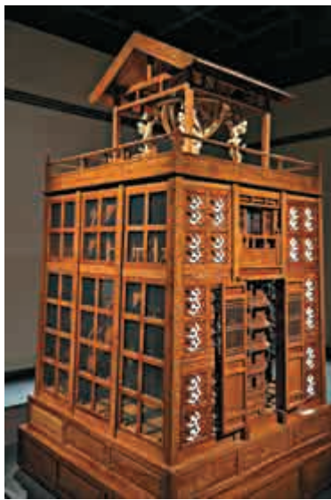
►宋代以水為動力運轉的天文鐘——水運儀象台