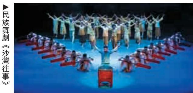
►民族舞劇《沙灣往事》