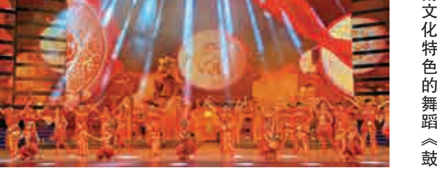
◀具嶺南文化特色的舞蹈《鼓舞嶺南》