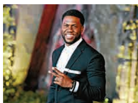
▲美國黑人諧星奇雲赫特6日放棄主持明年的奧斯卡頒獎典禮

赫特還在2010年的一次脫口秀中說：「我不是恐同，我不反對同性戀，但身為一個異性戀男性，只要可以防止我的兒子變成同性戀，我就會去做。」