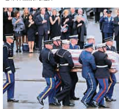
▲7日，老布什最後告別儀式結束後，靈柩被送往得州落葬

一號標誌的火車載往得州農工大學，搭乘火車走完人生最後約70英里的路途，是老布什生前的選擇。