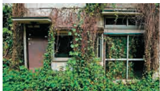
▲日本神奈川縣橫須賀的一棟鄉村房屋因閒置已久被樹葉覆蓋

【大公報訊】綜合CNN及《日本時報》報道：「免費贈送房屋。」這聽起來像是騙局，但隨着日本老齡化和少子化情形日益嚴重，以及鄉村年輕人前往城市工作，日本鄉村出現大量閒置空屋，有的更因年久失修變成「吉屋」。因此，不少鄉村開始低價出售甚至免費贈送房屋給願意入住者，以吸引民眾遷至鄉下。