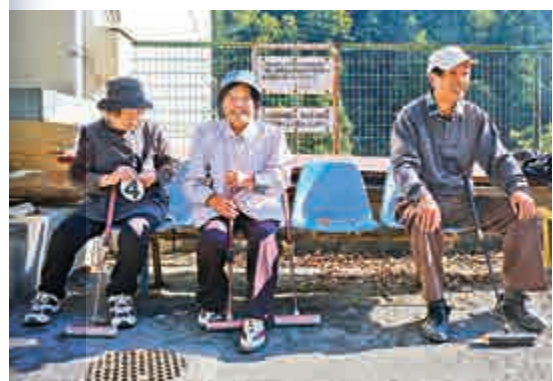
▲留在奧多摩町鄉村的居民中已鮮有年輕人

此外，日本政府已開始致力於讓大城市居民遷往鄉村。和奧多摩町不同，東京是世界上最擁擠的城市之一，給交通、醫療系統和其他公共事務帶來巨大壓力。據悉，政府還將設立補助金系統，幫助有意移居鄉村的東京市民購置房屋、找工作及創業。