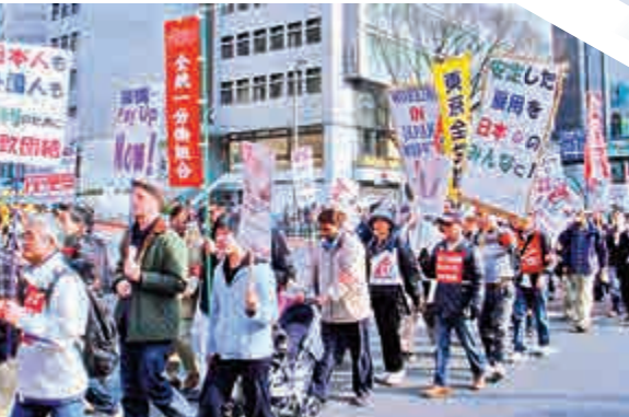
▲因剝削及待遇不公，日本的外國勞工曾多次抗議 網絡圖片