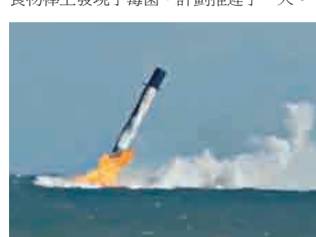
▲SpaceX的「獵鷹9號」火箭6日回收失敗，落入海中

這是SpaceX在展開類似任務以來首次回收火箭失敗。回收火箭的初衷是為了進行再利用，減少發射成本。「飛龍」號原計劃於5日發射，但工程師在裝載貨物到SpaceX火箭貨倉時，在一些試驗用老鼠的食物棒上發現了霉菌，計劃推遲了一天。