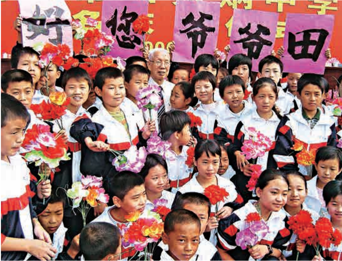
▲田家炳的事跡，深刻印在學生心中，默默影響學生的人生觀

▲田家炳基於「經商除了賺錢，應有更高理想」的信念，創辦田家炳基金會，致力捐助社會公益事業，尤其醉心教育