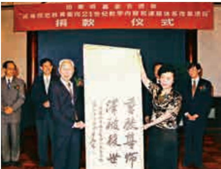
▲1997年，田家炳捐助國家教委實施「高等師範教育面向21世紀教學內容和課程體系改革計劃」

尤其難得的是，田家炳視其基金為社會公益事業而不是個人私產，他自2009年起就在基金會之內增設諮議局，廣邀本港各大校長出任成員，為基金會捐助方針和運作出謀獻策，而自己則轉任基金會榮譽主席。過去一年，田家炳基金會向本港各大學捐資，推動中華文化和道德教育，作為這個百歲慈善家對明日棟樑的期許。