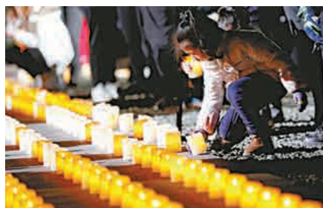
▲百餘人身着素服、手秉蠟燭，在為死難者哀悼、守靈