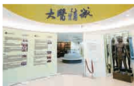
▲陳虎彪到浸大中醫藥學院教書後，才能建立「中藥方劑圖像數據庫」

陳虎彪教授2006年9月開始在浸大中醫藥學院執教至今，陳教授主要從事藥用植物學、中藥資源學及中藥質量評價與質量控制研究，其過往研究成果曾獲教育部及國家中醫藥管理局等省部級獎六項。