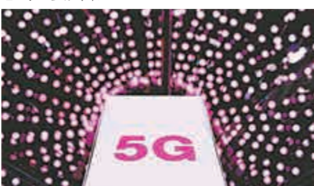
▲5G技術涉及人工智能、機械人、雲計算、工業自動化發展等產業升級

其實，中國願意讓步，爲的都是防止經濟硬着陸，因此，即使中美能於90天內達成協議，相信中國企業的盈利會因爲面對市場開放而受到威脅，這亦是來年投資者需要留意的重要因素。