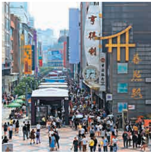
▲中國中產人口持續增加，消費不斷升級，本地消費市場強大，從而帶動經濟增長

明年爲新中國成立七十周年，中國經濟穩中向好勢頭不會變，爲全面建成小康社會奠定重要基礎。