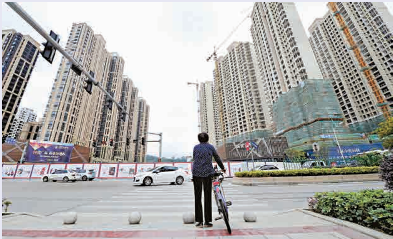
▲分析指出，房地產價格穩中趨降及股市價格回落等財富效應的減弱，使得居民的消費行為受到了影響