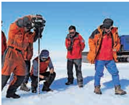
▲中國科考隊在南極冰蓋發現藍冰機場選址區

中國目前在南極建有4個考察站，另有一個考察站正在建設中，但尚未有一個永久性的機場。