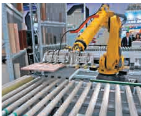
▲工業機器人展示工作場景

珠海一號遙感微納衛星星座，是中國首家由民營上市公司建設並運營的星座。目前，珠海一號的7顆衛星在軌運行正常，平均每5天就可以對全球覆蓋一遍。據介紹，珠海一號的4顆高光譜衛星是全球25顆高光譜衛星家族中重要成員，也是國內目前唯一完成發射並組網的商用高光譜衛星。