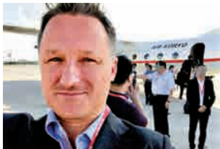
▲12日，因涉嫌危害中國國家安全，邁克爾·斯帕弗被依法審查

而在16日，加拿大駐華大使麥家廉獲准探視12日因涉嫌危害中國國家安全被依法審查的第二名加拿大公民邁克爾·斯帕弗。報道稱，14日，麥家廉獲准探視加拿大前外交官、國際危機組織分析師康明凱。10日，康明凱被報因涉嫌從事危害中國國家安全的活動，被中方依法審查。