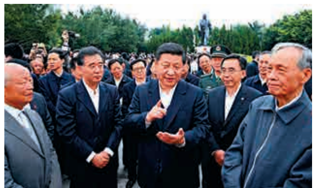
▲2012年12月，習近平在深圳蓮花山公園與當年參與特區建設的老同志交談 資料圖片

今年10月底，習近平又一次來到廣東，他說：「我們就是要在這裏向世界宣示：中國改革開放永不停步！下一個40年的中國，定當有讓世界刮目相看的新成就！」