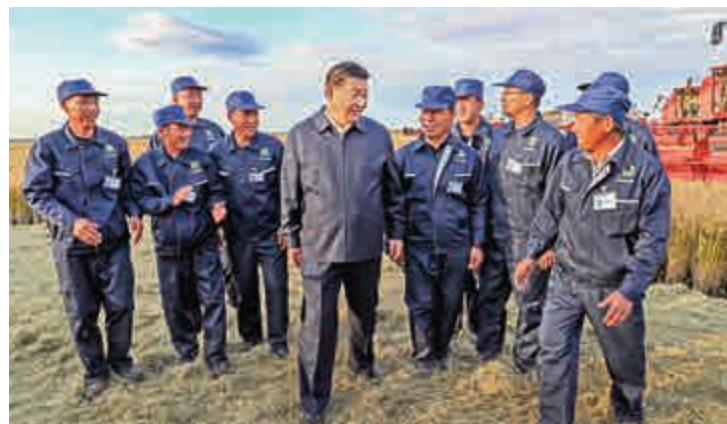
▲於今年9月，習近平在考察黑龍江時親切交談 資料圖片

中共十八大至十九大之間，習近平到基層考察50次、累計151天，這既是對改革的訪查和調研，又是對改革的宣講和推動。在習近平帶頭「撿起袖子加油幹」的鼓舞下，許多大膽的改革在基層開展起來。