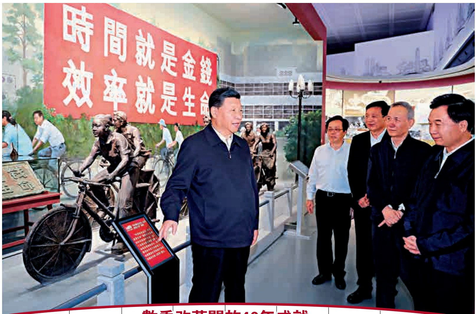
▲今年10月，中共中央總書記、國家主席、中央軍委主席習近平在深圳改革開放展覽館參觀「大潮起珠江——廣東改革開放40周年展覽」