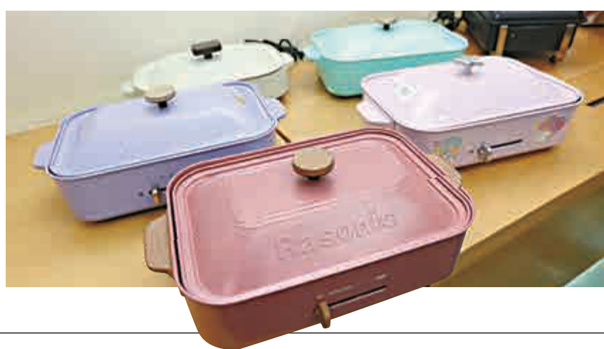
部分電熱盤漏電風險較高

機身量得最高表面溫度升幅為87.5K及71.1K，但欠缺標準要求的高溫警告標誌。消委會總幹事黃鳳嫻提醒，產品若經常跳掣，或有異味和怪聲，消費者則應馬上停用。