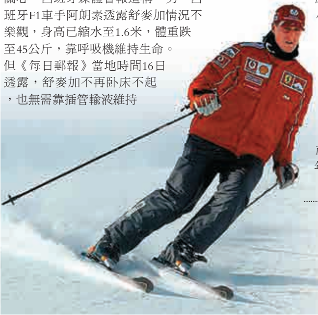
◀著名F1賽車手舒麥加五年前滑雪發生意外後昏迷

另外，舒麥加的兒子米克在父親遭遇意外時只有14歲，而如今19歲的他已成長為一名年輕車手。