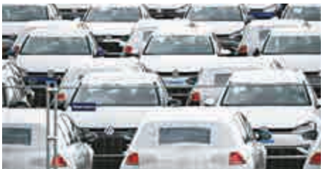
▲汽車行業發達的德國一直警告嚴格的減碳排目標可能損傷其利益

同時，汽車業也強烈反對此舉，警告這可能衝擊就業。德國汽車工業協會表示，這項新法律在提倡使用電動車方面，沒有付出多少行動或提供獎勵。