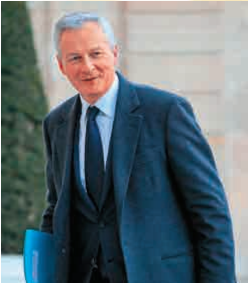
▲法國財政部長勒梅爾

報道指，法國此次率先向科技企業「開刀」，可能是因政府的預算不足，決定尋找新的收入來源。不僅如此，在馬克龍的呼籲下，歐洲最大的航空公司空中巴士日前還決定為其最低收入工人發放特別獎金。