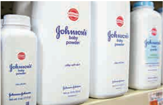
▲美國強生集團14日被爆出早就知曉其嬰兒爽身粉產品中含石棉

另外，強生股價14日暴跌10個百分點，創15年來最低，17日又下跌2個百分點，市值損失高達約400億美元（約3128億港元）。強生17日表示，將回購50億美元（約391億港元）股份，以刺激公司股價。