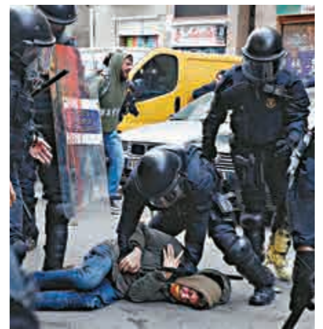
▲西班牙加泰獨立派21日與警方爆發衝突

有效對話」。西班牙政府同意將最低工資提高22%至1050歐元(約9386港元)，這是過去40年以來的最大增幅，並對加泰的基礎建設工程進行投資。有分析人士指出，這是桑切斯爲了2020年選舉的拉票行爲。