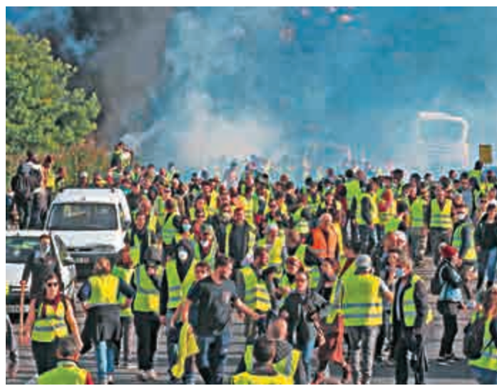
▲法國「黃背心」22日進行第六次示威

另外，馬克龍繼續成爲示威針對目標，21日是他41歲生日，有30多名示威者上街「贈興」。有示威者高舉「馬克龍辭職」的標語。而在法國第四大城市圖盧茲，同日有示威者上街，爲馬克龍「慶祝生日」。