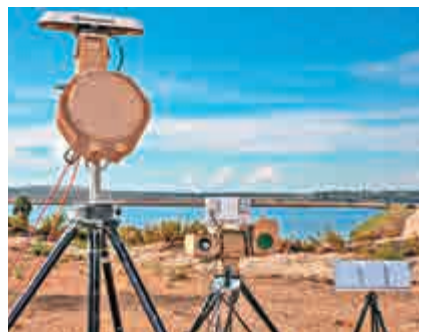
▲英國軍方21日使用的「無人機穹頂」系統曾被用於敘利亞戰場 網絡圖片

「穹頂」系統能鎖定周圍6英里的無人機，一旦發現目標，就可開啓無線電干擾系統，干擾無人機與操縱者的通信，奪過無人機的控制權，強迫其降落。以色列版本的「穹頂」系統還配有強力激光，能夠直接毀滅無人機，但英國軍方購買的版本不包括這個功能。最開始，英國警方使用了多個商業品牌的無人機偵察系統，但都未成功追蹤到無人機或是操縱者，最後只能啓用軍方系