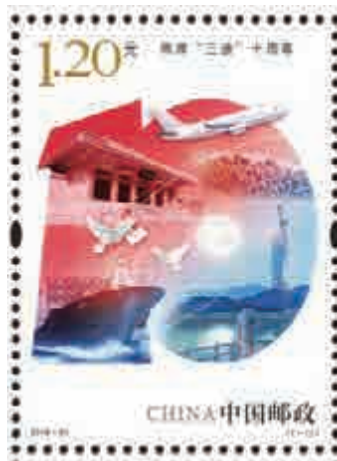
▲大陸發行兩岸「三通」紀念郵票

1989年6月台灣當局通過《簡化對大陸通信辦法》。台灣民眾可直接在信封上寫大陸親友名址，並比照港澳地區資費規定貼足郵票後投寄。1993年兩岸舉行第一次「汪辜會談」後，終於實現雙向互寄掛號函件，並互辦查詢、補償業務。