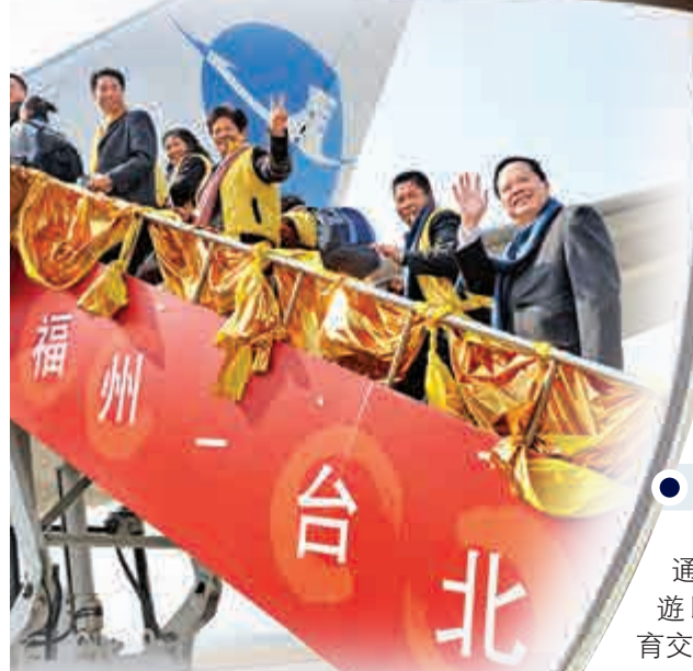
▲2009年兩岸包機改為定期直航