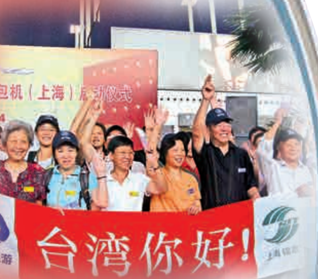
▲2008年上海赴台遊首發團出發前興奮揮手 資料圖片