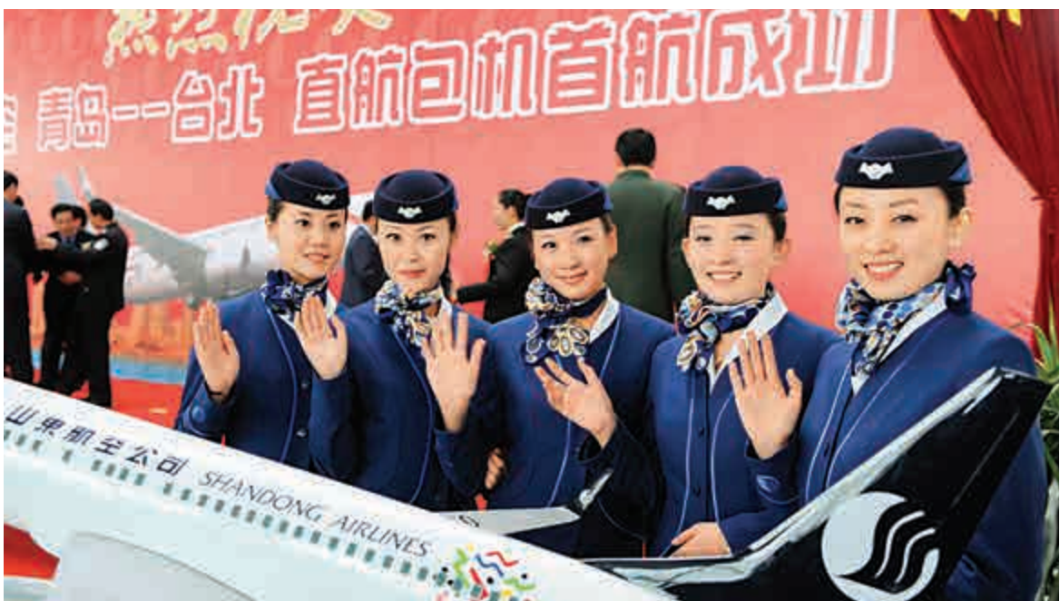
▲兩岸直航為兩岸民眾往來與交流提供了很大的便利 資料圖片

「兩門對開，兩馬先行」（在福建廈門和台灣金門之間，在福建馬尾港和台灣馬祖之間先開設海上