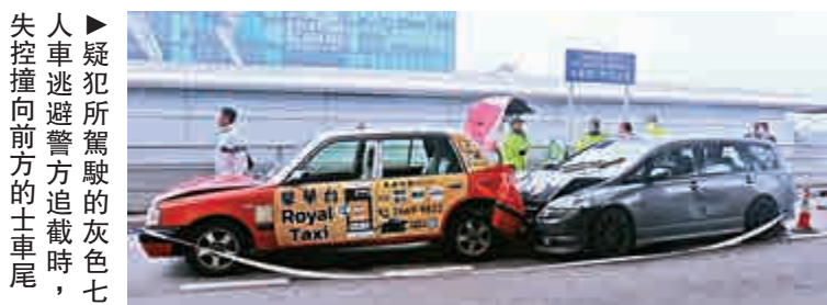
疑犯所駕駛的灰色七人車逃避警方追截時，失控撞向前方的士車尾