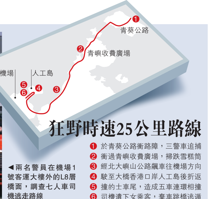
狂野時速25公里路線

平安夜變瘋狂夜！一輛毒品快餐車疑在平安夜通宵派貨，昨凌晨駛至青葵公路近長青隧道時，踩油超越警方打擊酒後駕駛的路障，與警方展開追逐戰，狂飆逾25公里後，在機場一號客運大樓外失事，釀成包括兩輛警車在內的五車相撞。司機棄下女伴落車，亡命飛身跳落橋下四米的露天升降機頂逃遁。一名曾任機場特警的交通部高級警員，追捕疑犯時腳部骨折受傷，警方在車上檢獲近8000元冰毒及吸毒工具，拘捕一名女乘客，正通緝禿頭司機歸案。