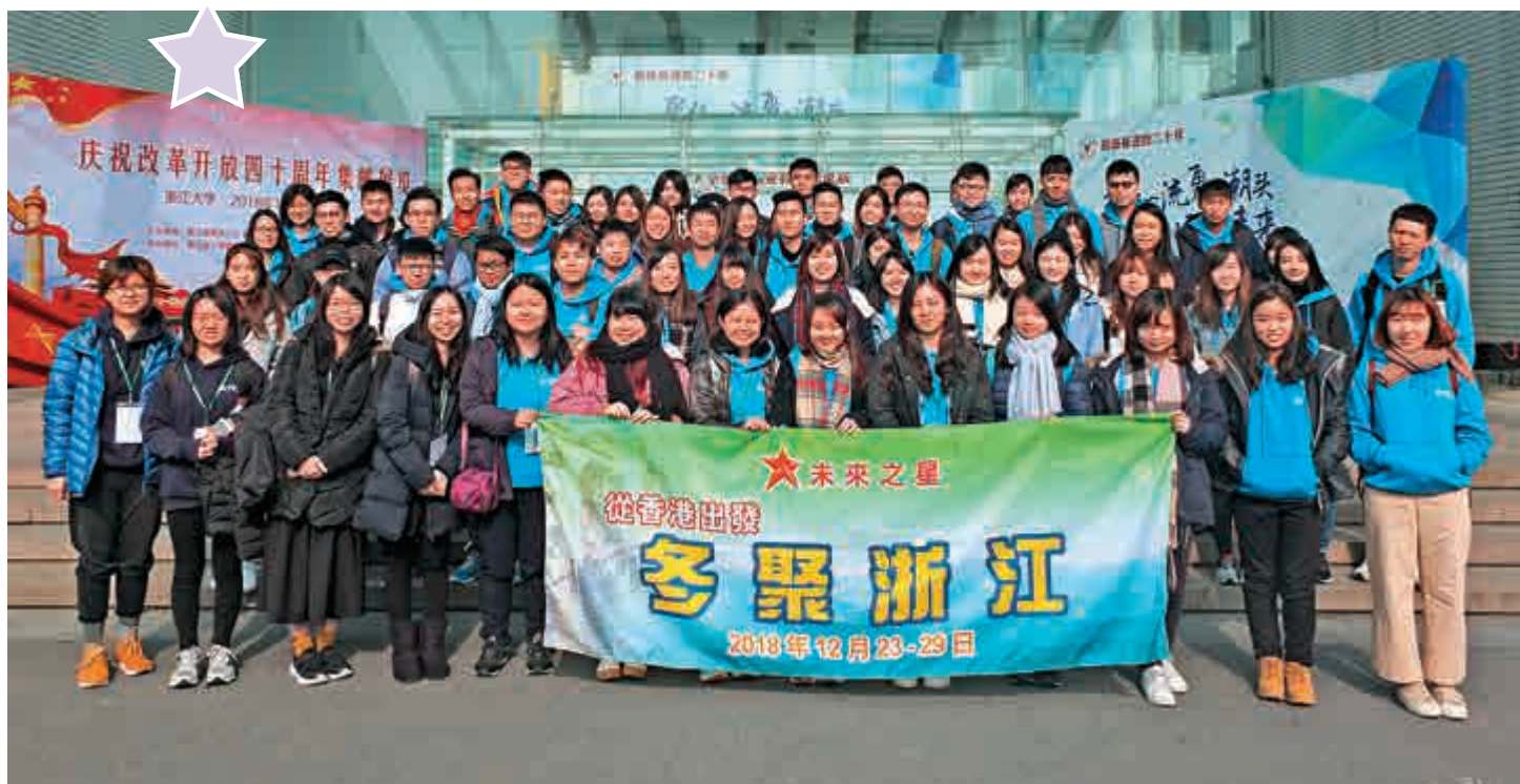
「冬聚浙江」團員在浙江大學合影

開班儀式上，香港大公文匯傳媒集團選與浙江海外聯誼會簽署了《關於合作舉辦兩地青少年國情認知活動的框架協議》。