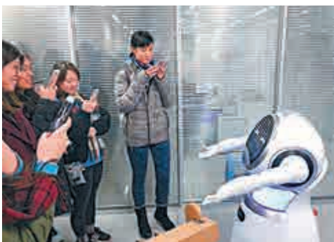
▲港生與浙江大學創業團隊自行研發的機器人互動

24日，交流團的第一站就來到了內地知名學府浙江大學，三位來自浙江大學的創業團隊負責人向同學們分享了自己的創業創新