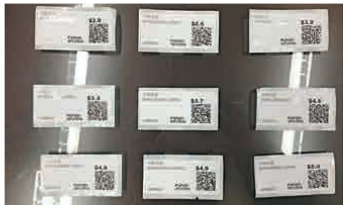
▶ 郵資標籤售賣機提供多達九種預設郵資面額