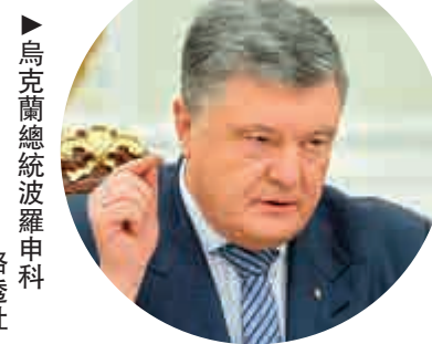
▲烏克蘭總統波羅申科

2018年11月25日，俄羅斯與烏克蘭在刻赤海峽發生衝突，俄方扣留3艘烏海軍艦隻和24名軍人。烏克蘭最高拉達(議會)於11月26日通過總統令，宣布烏克蘭10個與俄鄰近的地區進入爲期30天的「戰爭狀態」。