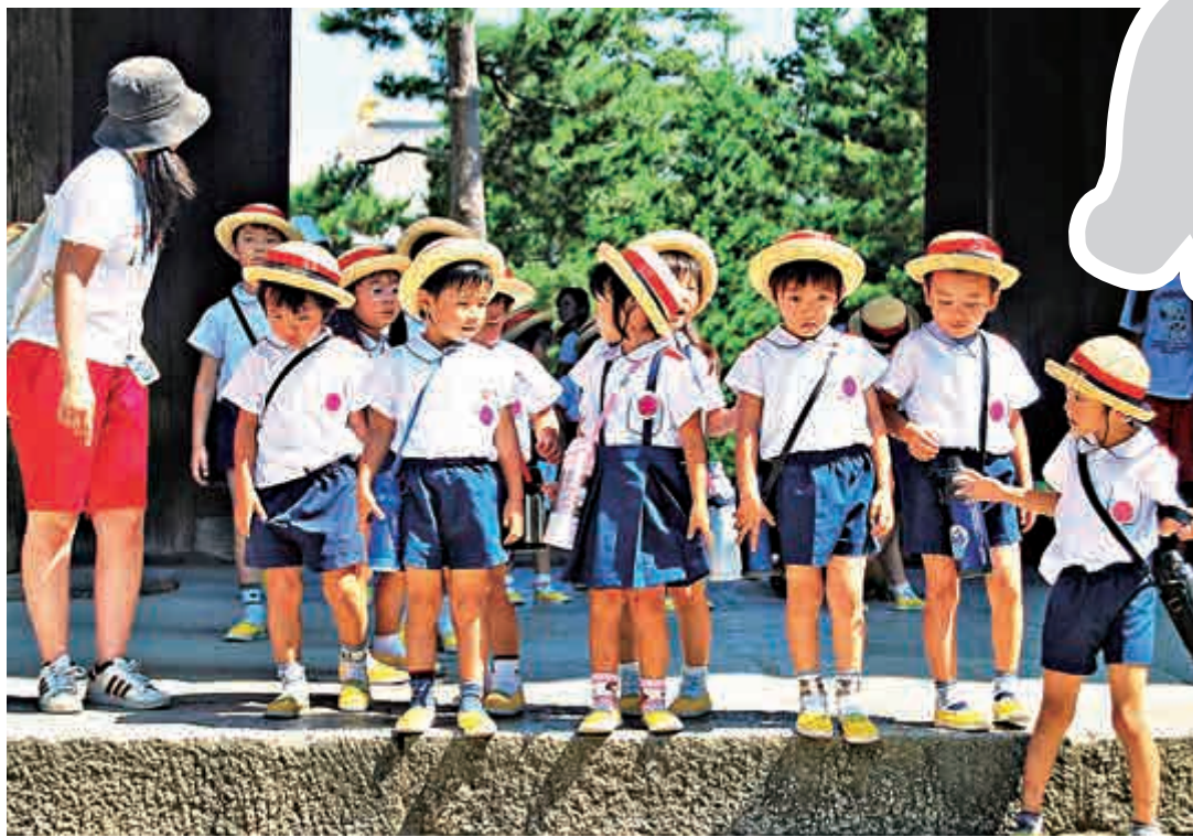
◀日本將於明年對3至5歲的兒童實行教育免費。

【大公報訊】據共同社、CNN、《衛報》報道：日本社會的少子化危機嚴重，預計今年新生兒數量將創1899年來的新低，令日本人口實際減少44.8萬。為了應對危機，28日，日本政府正式決定明年10月起對3至5歲的幼童實施教育免費化。高等教育免費化決定2020年度起施行，將向低收入家庭的大學生發放無需返還的補貼型獎學金。