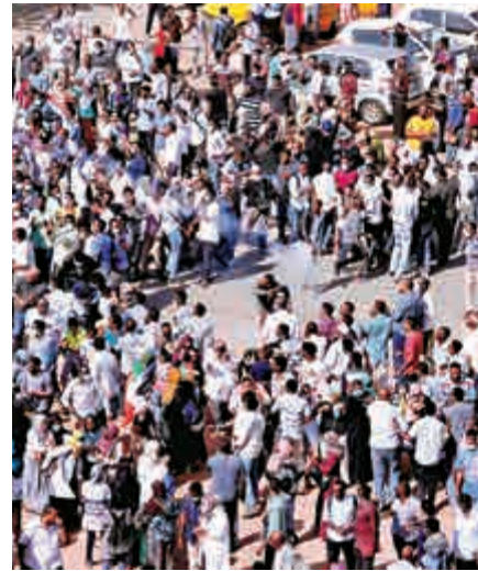
▲25日，蘇丹示威者在喀土穆將投向他們的催淚彈扔回。

蘇丹北方州衛生部長格利納斯27日辭職，他所在的烏瑪改革復興黨從該國主要反對黨國家烏瑪黨分裂而來，而國家烏瑪黨黨魁是前總理邁赫迪，他於1989年被巴希爾趕下台。