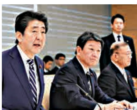
▲28日，日本首相安倍晉三（左一）在政府會議上發言。

日本人素以長壽著稱，女性平均壽命已經達到87.2歲，男性則為81.01歲。美國有線電視新聞網報道指出，日本已成「超齡」（super-aged）國家。今年初日本政府統計年屆70歲或以上的老年人口達2610萬，或佔全國人口逾兩成。全國人口及社會保障研究所預測，2040年將有逾35%的人口年屆65歲或以上。目前，日本總人口為1.24億人，估計到2065年可能只剩8800萬人。