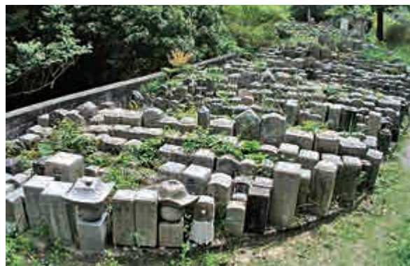
◀日本無人祭掃的「無緣墓」。網絡圖片

此外，日本地方政府亦討論在2020起逐漸整備「無緣墓」，例如將沒有繳納公墓管理費的墳墓合葬，並收回「無緣墓墓地」，加以整理和活化。不少網友在社交平台留言指，「出生率減少，少了人去掃墓，正正反映社會在轉變」、「墓園大都在偏遠的地方，現代人生活忙碌，也實在難抽時間」。