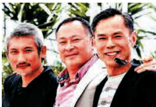
▲2007年，林嶺東（右）與徐克（左）、杜琪峯（中）合作拍攝電影《鐵三角》

擅長拍動作電影的林嶺東，1955年出生，早年考進第三屆無線電視藝員訓練班，與周潤發及任達華於1974年同期畢業。畢業後，他轉向幕後發展，並移民海外，曾執導過多齣賣座電影，如1983年由譚詠麟主演的《陰陽錯》，到87和88年，因《龍虎風雲》、《監獄風雲》和《學校風雲》三部曲奠定導演地位，更憑《龍虎