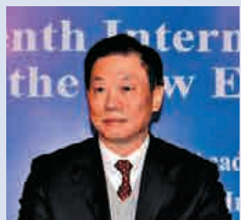
▲鄧中華獲國務院任命為港澳事務辦公室副主任

2013年起，鄧中華先後任中央外事工作領導小組辦公室海洋權益局局長，中央紀委駐中國社會科學院紀檢組組長、院黨組成員，中央紀委國家監委駐中國社會科學院紀檢監察組組長、院黨組成員。