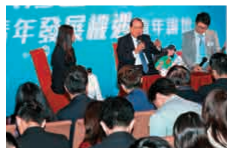
▲張建宗在論壇上鼓勵港青年把握時機裝備自我，開拓視野了解國情

張建宗認為，大灣區的發展沒有時空限制，「青年人有的是時間和精力，這並非龜兔賽跑，非爭一日之長短」，他鼓勵本港年輕一代多到各城市實地感受當地發展，進一步了解國情，在知識儲備、實踐經驗等方面充分「裝備自我」，為應對求學、就業乃至創業等挑戰做足功課。