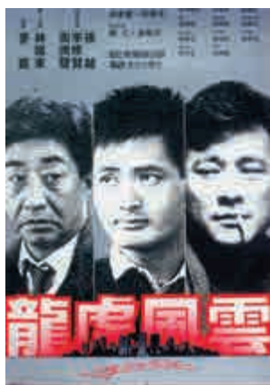
▲林嶺東憑《龍虎風雲》奪得第七屆香港電影金像獎最佳導演

風雲》更上一層樓，勇奪第七屆香港電影金像獎最佳導演，該片主角周潤發也奪得「最佳男主角」。