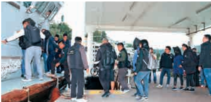
▲水警總區重案組昨晨於南丫島拘捕五名涉嫌犯毒南亞裔男女

同時，在洪聖聖一村屋單位則檢獲約1.6克懷疑大麻、一把約26厘米長的咭刀及一個「鐵蓮花」，拘捕一名菲律賓男子