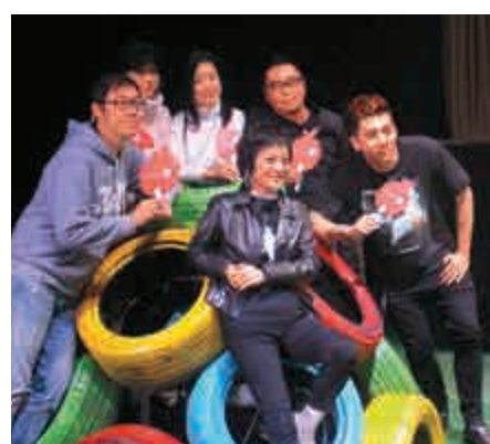
▲張艾嘉與年輕表演者合影

【大公報訊】據中新社報道：台灣知名演員、導演張艾嘉於1988年創立的財團法人果實文教基金會，30日在台北進行演出綵排並與媒體交流。張艾嘉出席活動並表示，希望年輕人早一點找到喜歡的生活，不要浪費時間和機會。當天，主題為《你好嗎？》的綵排演出，表演者來自2009年至2017年間曾參加「果實藝術創作營」的學員，年齡從16歲至25歲不等。在一個多小時的演出中，年輕人盡興地表演、唱歌、跳舞，讓舞台變成熱鬧的「遊樂場」。