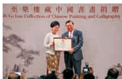
►行政長官林鄭月娥向至樂樓頒予感謝狀

香港藝術館在短短約一個月內先後獲得這兩次重要捐贈，再次確立香港在傳承中華文化、守護文化瑰寶和蓄萃中西藝術的國際地位。