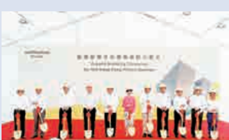
►「香港故宮文化博物館」動土，將故宮館藏帶來香港

香港故宮文化博物館未來可令市民隨時欣賞長期展覽的國寶級文物，亦向外國遊客推廣中國文化，同時還將着重在策展、文物修護和教育等方面的軟件發展，提供與其他博物館在研究和教育方面合作的機遇，從而促進香港、內地和世界各地的文化交流和合作。故宮館館長人選目前正在物色當中。