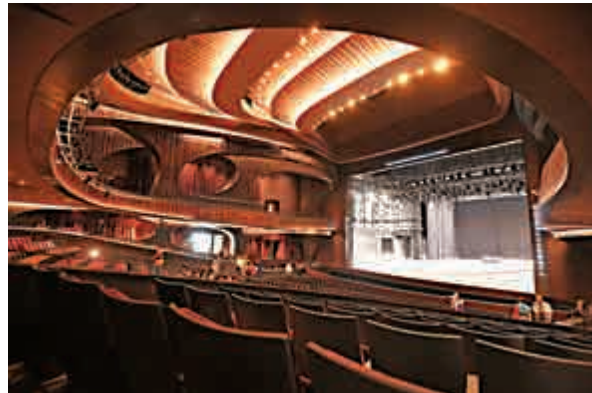
▲西九戲曲中心大劇院

此外，樓高十六層、佔地六萬五千平方米的M+大樓亦於11月30日舉行平頂儀式，預計明年年底竣工，2020年下半年開幕，四成藏品為捐贈所得，至今購藏開支約6億港元。