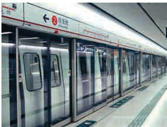
港鐵為期半年的「程程九七折」優惠完結，今日起加價3.14%。

月向合資格住戶每月發放50元電費補貼，每戶最多可拿取3000元。大欖隧道今日起加價，私家車及的士隧道費加至48元，電單車加至22元，輕型貨車加至49元，小巴維持100元不變。房委會轄下157個停車場的月租泊位，今日起加價3%至8%不等。