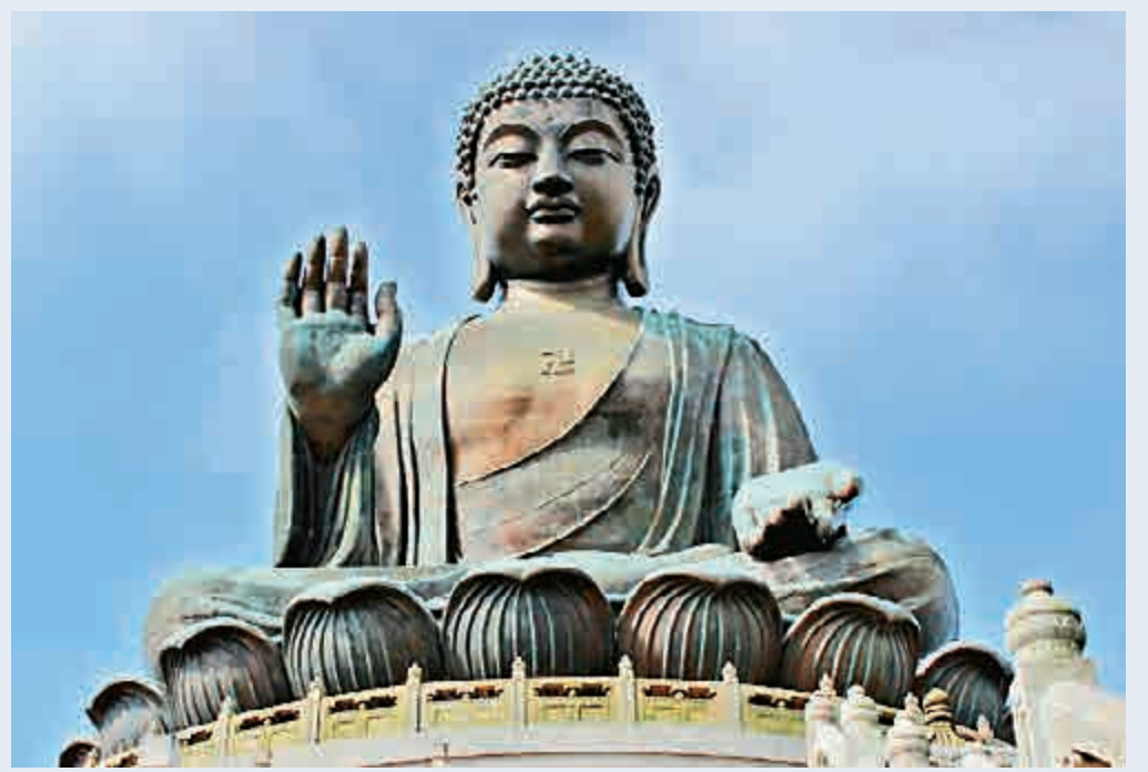
▲佛教傳入中國後信徒便以佛像為佛