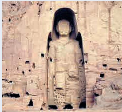
▲阿富汗巴米揚大佛雕像遭塔利班所毀 資料圖片

小國之一的犍陀羅國達到了高峰。它賦予東方佛教傳播的新途徑、新視野，那就是佛像的誕生。佛像的誕生對於佛教的推廣、傳播，如風推雲，人們彷彿在一夜之間才明白，佛像比佛經的傳播更直接、更明快、更感性、更親切，也更易為廣大信徒所接受。佛像也彷彿在一夜之間東傳至印度直至中國；西傳至巴基斯坦直至整個恆河流域。這些佛像的雕刻創作，大多在公元一世紀至公元四世紀。佛像的佛頭上分大小兩層鬚，上層鬚小，下層鬚大，鬚上髮絲畢畢畢見。佛像面帶微笑；雙唇自然合起，又彷彿在輕動；似言似誦，也似笑似威。雕刻得太傳神了；鼻不像以後在中國流行的那樣是直管，而是更寫實，更像現實中的人；眼睛微閉，能清晰地看見佛像的眼袋，眼皮稍稍鼓起，眼