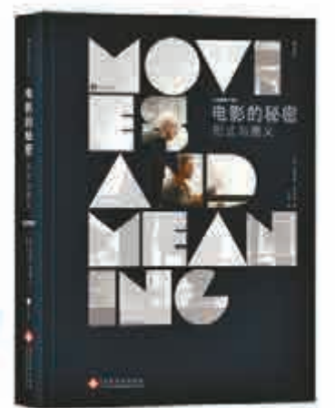
懂電影 ▲《電影的秘密》一書教讀者如何看懂電影

當初，我會帶着疑惑開始讀這本書，如今，我是帶着收穫合上這本書的，看着自己的筆記上記錄的一頁頁知識和理解，有着前所未有的滿足。《電影的秘密》帶