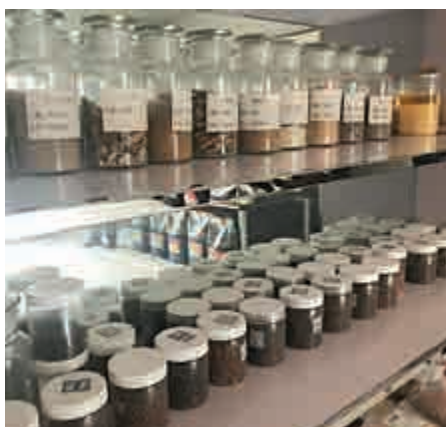
▲研發室存放着各種基料和成品標本