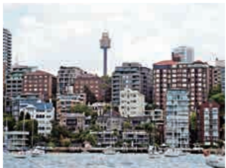
▲有分析人士預料，澳洲悉尼房屋市場於2019年跌勢將會加劇；圖為悉尼海港沿岸住宅物業

澳元方面，周三會跌0.7%，至70.04美仙；IG集團分析師表示，澳元走勢波動增加，勢將帶動更多套息交易平倉。