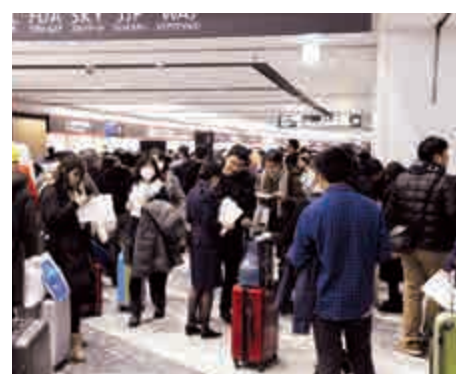
▲日本新千歲機場5日受暴雪影響，約2000名乘客滯留