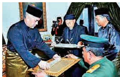
▲穆罕默德五世（左一）2017年4月舉辦登基儀式 網絡圖片