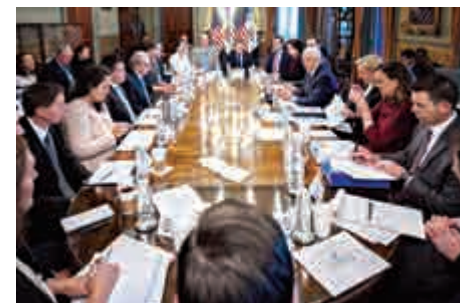
▲特朗普政府與民主黨5日的協商仍然無見成果

兩黨的角力仍在繼續，在停擺期間無薪還必須上班的部門，則蔓延起一股「請假潮」。美國運輸安全局（TSA）4日稱，該局工作性質決定員工必須上班，但聖誕節後請假人數越來越多，對安檢的速度產生輕微影響。例如，得州達拉斯-沃斯堡國際機場4日平均每個班次有25人請病假，比率為5.5%，較平常的3.5%略多。