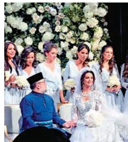
▲傳媒指穆罕默德五世與俄羅斯嫩模沃沃迪娜於去年11月隱婚