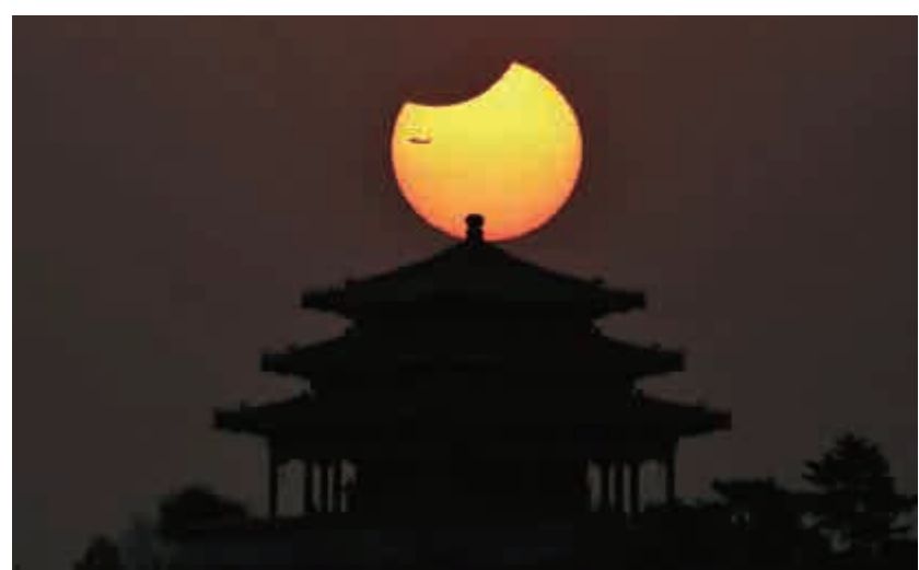
▲中國北京北海公園6日拍到的日偏食

除日本，今次日偏食在俄羅斯、中國大陸及台灣地區也可見到，其中俄羅斯東部可觀測到62%的太陽被遮擋。