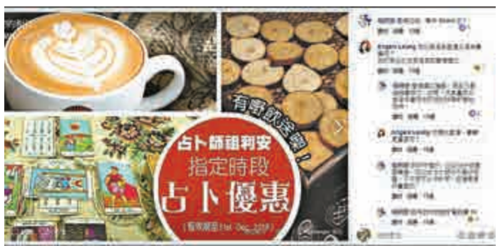
▲「獨粉」網友向祖利安占卜「港獨」的可行性，祖利安竟問人有無犧牲性命的準備

根據《侵害人身罪條例》，任何人協助、教唆、慫恿或促使他人自殺或企圖自殺，即屬干犯可循公訴程序審訊的罪行，一經定罪，最高可被判監14年。倘有無知「港獨」信徒信以為真，浪費生命，背後搞煽動的禍首也刑責難逃。