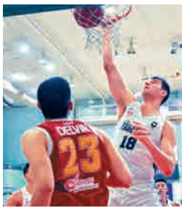
▲東方的迪古拿（右）入樽得手

第3節結束後，騰飛之獅以64:59稍微領先5分。末節初段，東方在後衛巴錫和艾利諾的連續得分下順勢反超比分，並且成功將領先優勢保持到比賽結束。